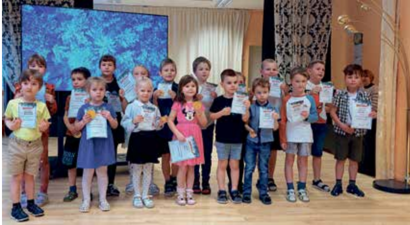
Участники конкурса чтения стихов.

детям лучше узнать традиции праздника. И никого не оставили равнодушными угощения, ведь в Вастлапяев наши дети обедают по специальному меню: едят гороховый суп, а так же угощаются маслянистыми булочками.