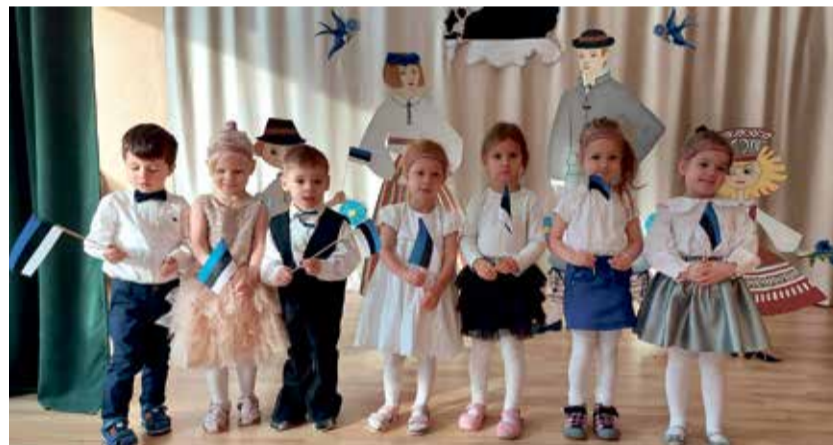
Дети группы Pöial-Liisi в День независимости Эстонской Республики 2023.

Следом за Вастлапяев пришел день друзей. Быть другом не только почетное, но и ответственное дело. Ведь дружить нужно уметь, а иметь друзей это большое счастье. Именно этому на протяжении всего пребывания в детском саду учатся наши дети. А в такие тематические дни дружки ребята могут показать, чему научились.