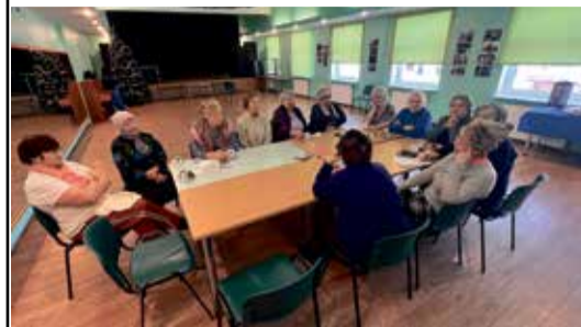
Жители Ольгина обсуждают будущее народного дома.

Во многих прогнозах на будущее отмечается ускоренный рост на основе сообществ. Укрепление сообществ ведет к достижению вовлекающих, справедливых и устойчивых результатов в развитии. Основная задача заключается в том, как максимизировать потенциал местных сообществ для эффективного участия в процессах развития. Эта проблема все чаще осознается и решается местными властями.