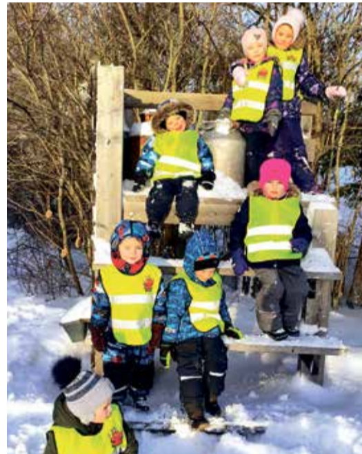
Дети из группы Ожак отправились кормить птиц.

К радости детей, нынешняя зима очень щедрa на снег. Из-за этого катание на санках остается любимым занятием, и доставляет удовольствие детям и взрослым особенно в Вастлапяев. Кроме