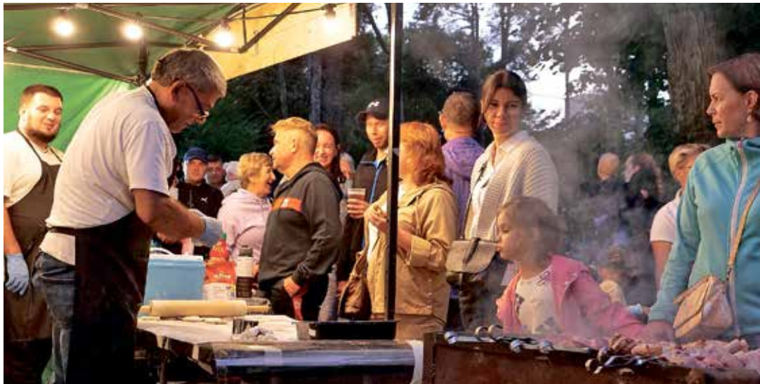
На ОВаззаг пекли и пирожки.

Впервые официальный прием мэра Нарва-Иъэсуу Максима Ильина состоялся в разгар ярмарочной жизни, предоставив желающим возможность неформально пообщаться с мэром. Множество людей стояло в очереди перед