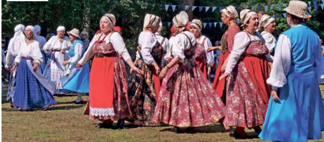
На певческом празднике были и зажигательные танцы.

танцполе на газоне Светлого парка не было отбоя.