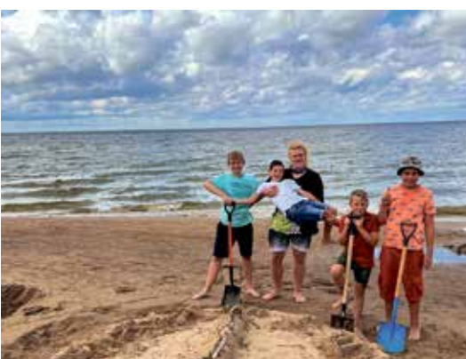
...и наслаждаются пляжными забавами.

Перечисление того, что еще было создано и сделано за эти 5 лет займет много текста, но хочется упомянуть самое большое и значимое. Было сформировано Молодежное собрание из ребят в возрасте 13-26 лет, которые работают на улучшение городской среды для нужд молодежи и решения их проблем. Молодые парни и девушки, входящие в состав собрания, являются голосом молодежи на городском уровне и доносят вопросы и проблемы