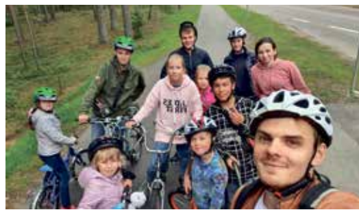
Молодые занимаются спортом...

Молодежный центр Нарва-Йыэсуу открыл свои двери 5 лет назад, а именно 15.09.2018 года по адресу Кеск 3. И сегодня мы подведем своеобразный итог тому, что было сделано за это время.