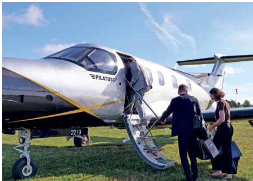
С собой взяли много подарков.

Основной целью визита является представление потенциала создания авиасообщения между Ида-Вирумаа и Юго-Восточной Финляндией. Кроме того, делегация