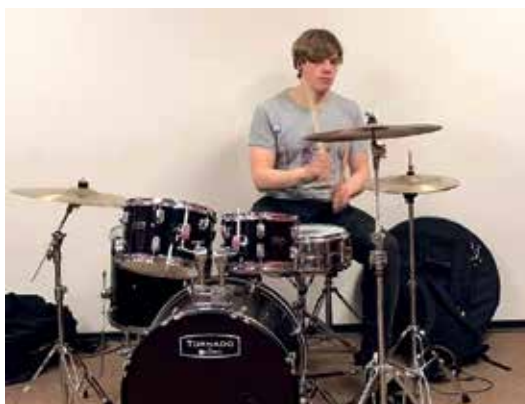
...играют на инструменте...

Комментарии и возражения по проекту проектировочных условий можно представить в городскую управу Нарва-Йыэсуу по почтовому адресу J. Poska tn. 26, 29023 Narva-Jõesuu или по электронной почте на следующий адрес info@narva-joesuu.ee . Срок подачи предложений и возражений – 14.09.2023 года.