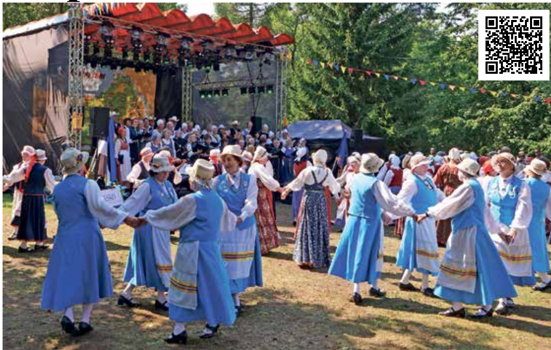
Laulupeolt ei puudunud ka hoogsad tantsud.

Peol osalejate poolt jäi kõlama mõte, et see laulupidu võiks saada traditsiooniks ning seda just Narva-Jõesuus külalislahkes ja ääretult kauni