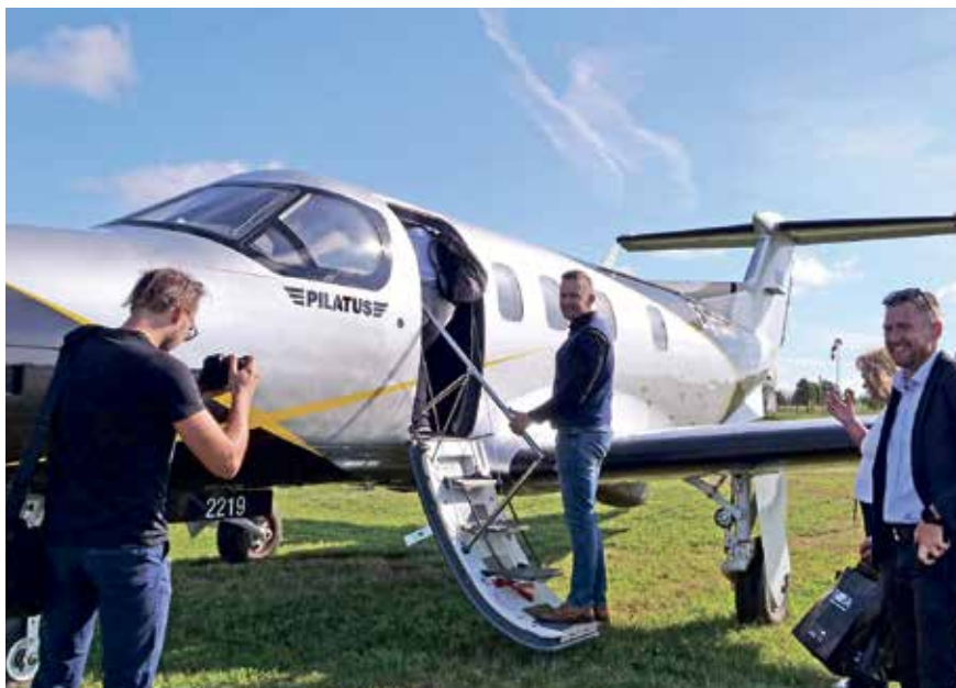
Lend Soome võib alata.

Visiidi eesmärgiks oli demonstreerida Ida-Virumaa ja Kagu-Soome vahelise