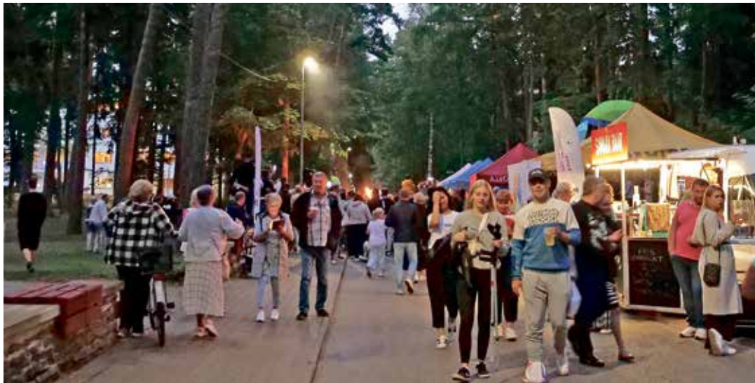
ÖÖBazaar nautiseid nii suured kui ka väikesed.

Esmakordselt toimus keset laadamelu Narva-Jõesuu linnapea Maksim Iljini ametlik vastuvõtt neile, kes linnapeaga mitteametlikus õhkkonnas suhelda soovisid ja kabinet-telgi ees „oma korda“ ootavate inimeste hulka hinnates, osutus selline, pretsedenditu linnapea vastuvõtu vorm, ootamatult populaarseks.