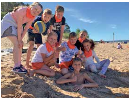
...ja naudivad rannamõnusid.

noorte küsimusi ja muresid linnaametnikele, et ühiselt lahendusi leida.