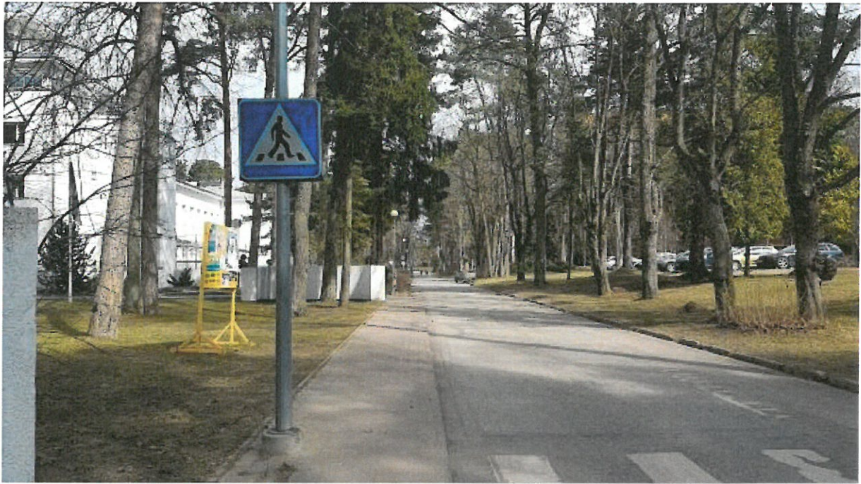
Foto nr 3. Vaade Aia tn-le, mööda detailplaneeringu ala.