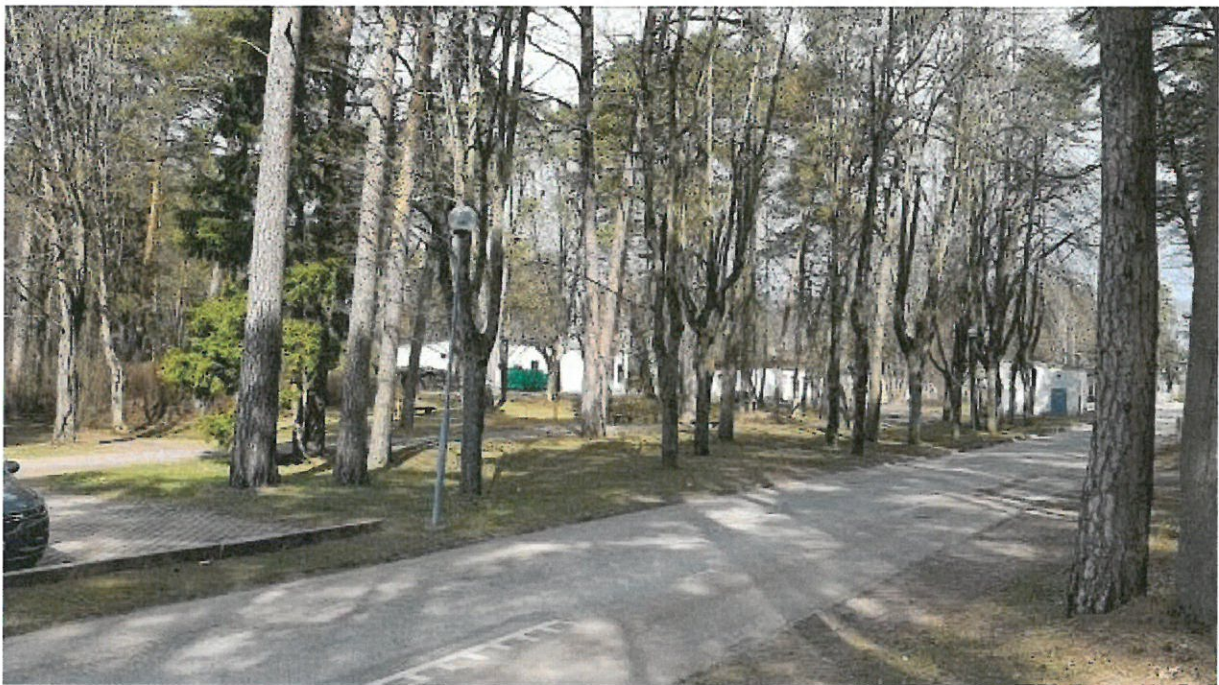
Foto nr4. Vaade detailplaneeringu ala sisse, eeldatavasti kavandatava uue kaheksa korruselise hoone asukoht.