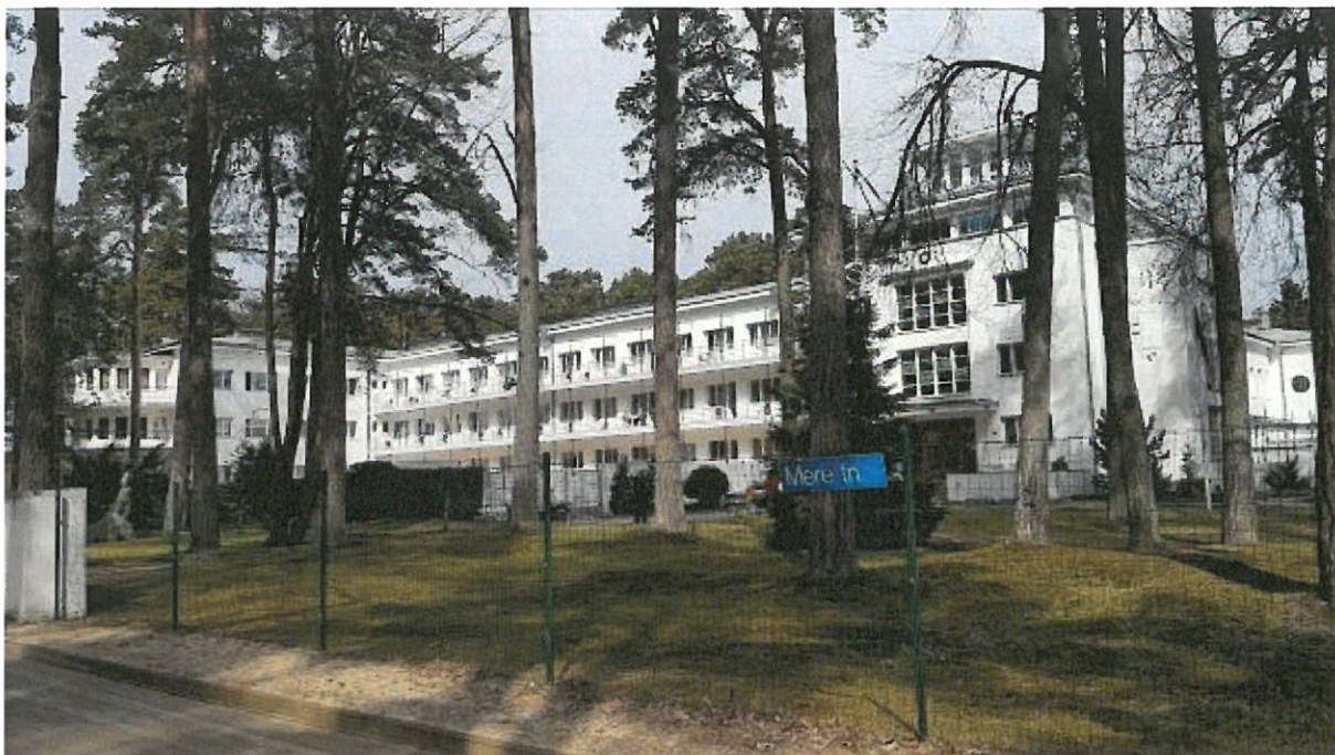
Foto nr 1. Vaade detailplaneeringu alale, olemasolev sanatooriumi hoone. Sanatooriumi hoonele kavandatakse juurdeehitust.