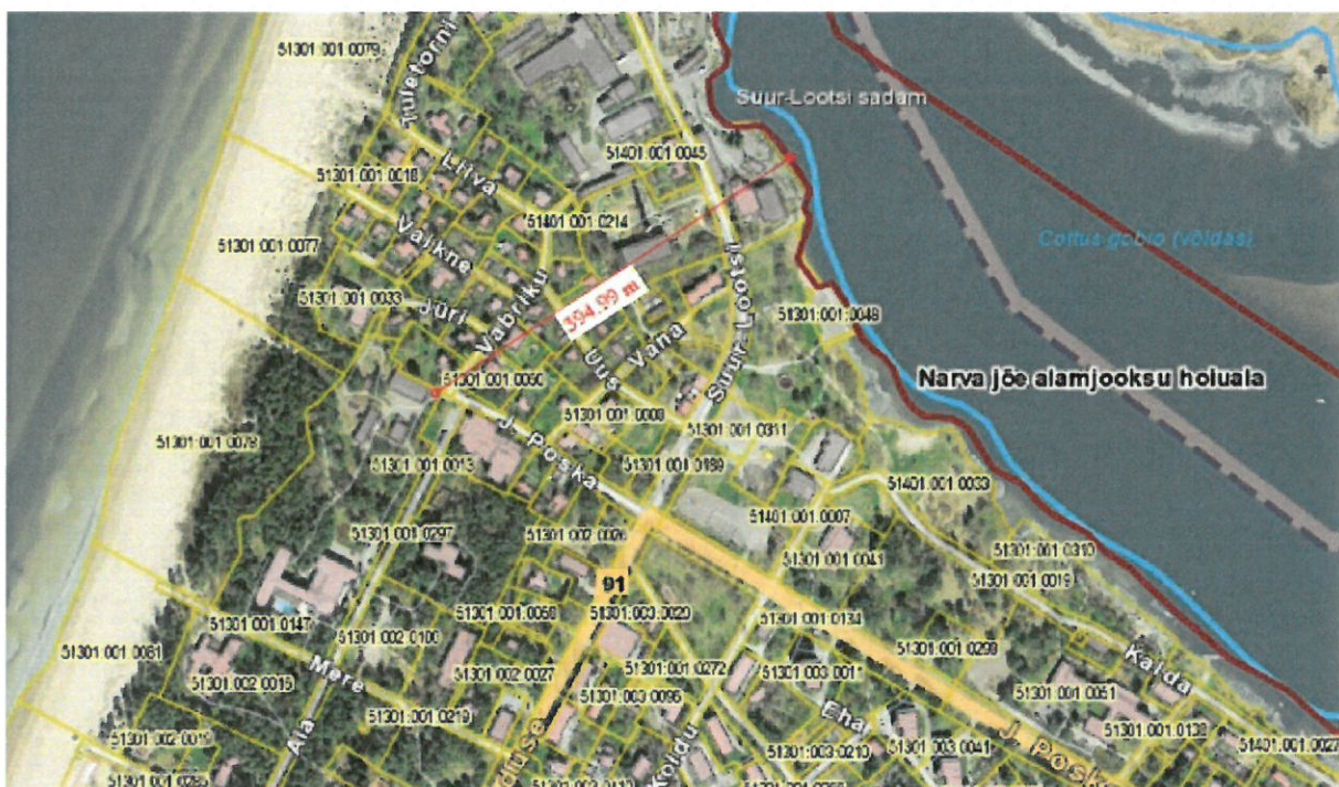
Joonis 3. Looduskaitse-ja Natura 2000 alad

Mõju Natura 2000 võrgustiku alale ja kaitstavatele loodusobjektidele ja –liikidele