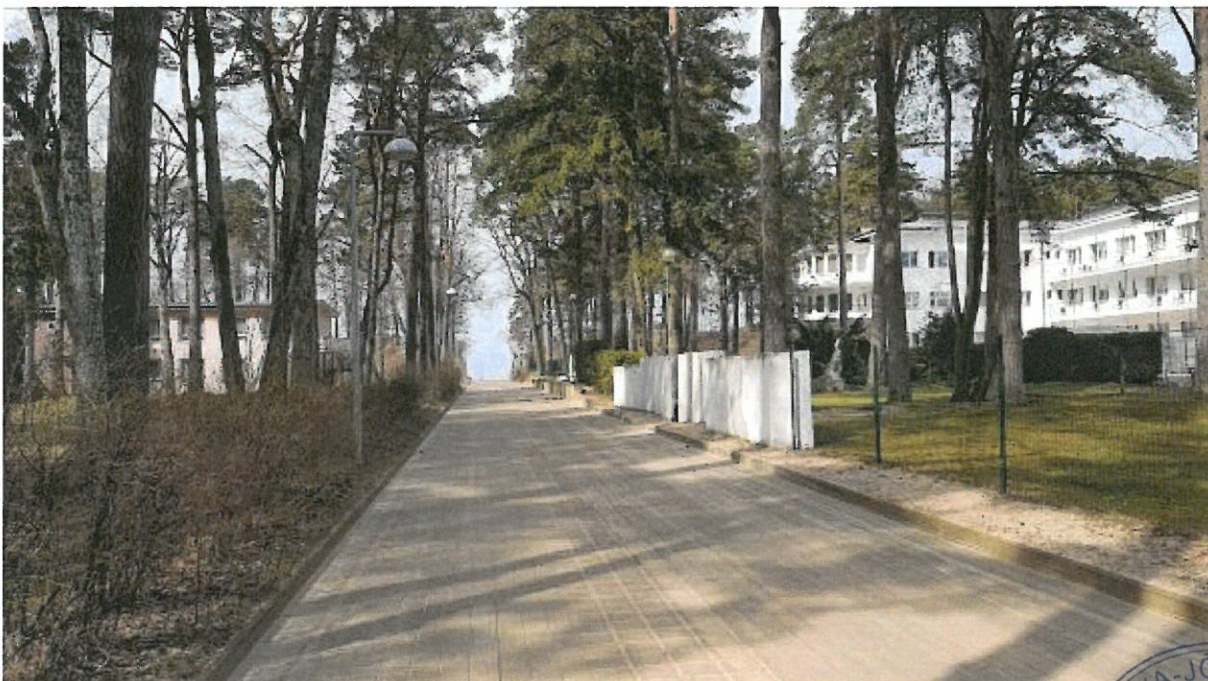
Foto nr 2. Vaade mere poole Mere tänavalt, olemasoleva sanatooriumi hoone kõrval.