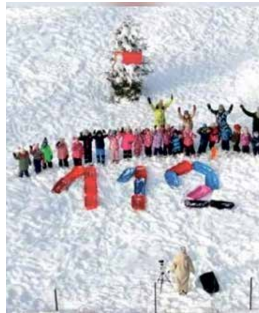
Проект „От снега к снегу 112“.

Самым важным событием, конечно же, было празднование дня рождения Эстонии,