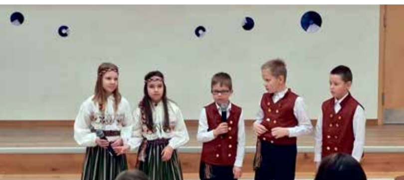
На праздновании годовщины в школе Синимяэ.

12 марта нашу школу посетил Hariduskopter и 26 будущих учителей, специалистов, которых интересовали возможности трудоустройства в Ида-