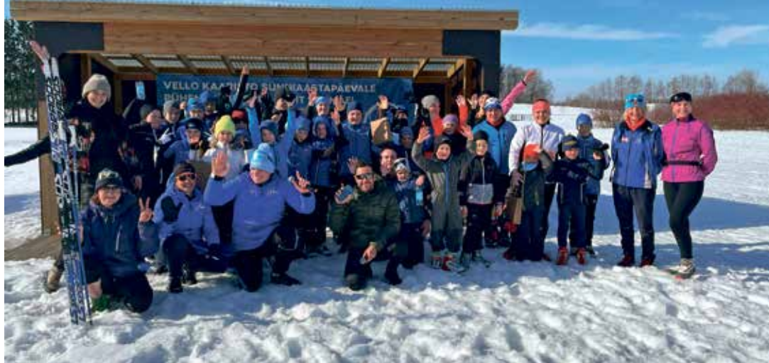
Веселая компания, принявшая участие в лыжном походе.