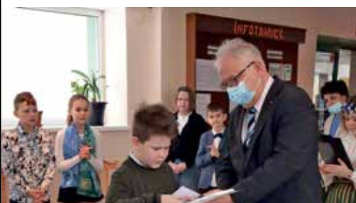
День рождения родной страны в школе Нарва-Йыэсуу.

На конкурсе чтецов звучали стихотворения эстонских поэтов, прославляющих родной край. А победители конкурса не только выступили на празднике в школе, но и получили право приветствовать жителей города на торжественном мероприятии поднятия государственного флага 24