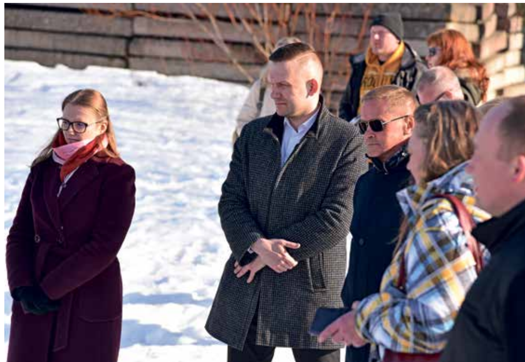
Гости знакомятся с расположением пирса.

Строительство пирса даст развитию города Нарва-Йыэсуу сильный социально-экономический толчок, поскольку откроет двери крупным частным инвестициям. Многие предприниматели, желающие развивать промышленность и недвижимость в устье реки Нарва, при принятии инвестиционного решения ставят условием строительство пирса. «Многие