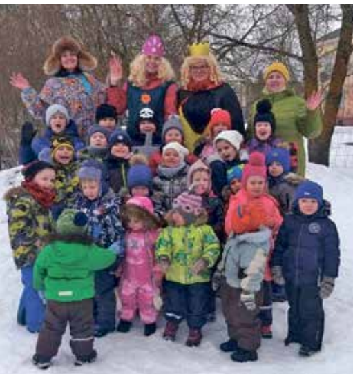
На Масленицу в детском саду Ольгина.