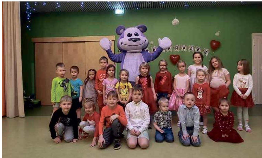
В день друзей в гостях был медведь, с которым было здорово играть.

которое состоялось в детском саду Вайвара 23 февраля. На день рождения были приглашены гости, и в этот раз к нам пришла собачка Лотте, с которой дети играли, танцевали и читали стихи, посвященные дорогой родине. Также был и торт по случаю дня рождения. Да здравствует Эстония!