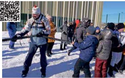
На первом общем спортивном дне.

«Беречь Вирумаа будут вирусцы» – во время этой песни я понял, насколько велика роль каждого ученика, учителя, родителя и работника нашей