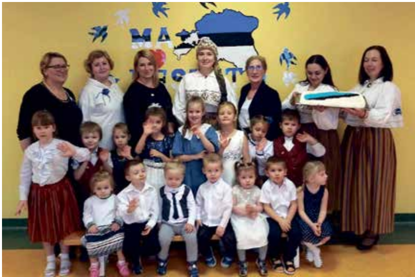
Праздник дня рождения в детском саду.

Концерт начался с гимна, после чего последовало выступление директора. Учителя были одеты в эстонские национальные костюмы. Дети играли таких героев, как Толстая Маргарита и Старый Томас. Во время праздника самые маленькие ребята познакомились с нашим эстонским национальным флагом