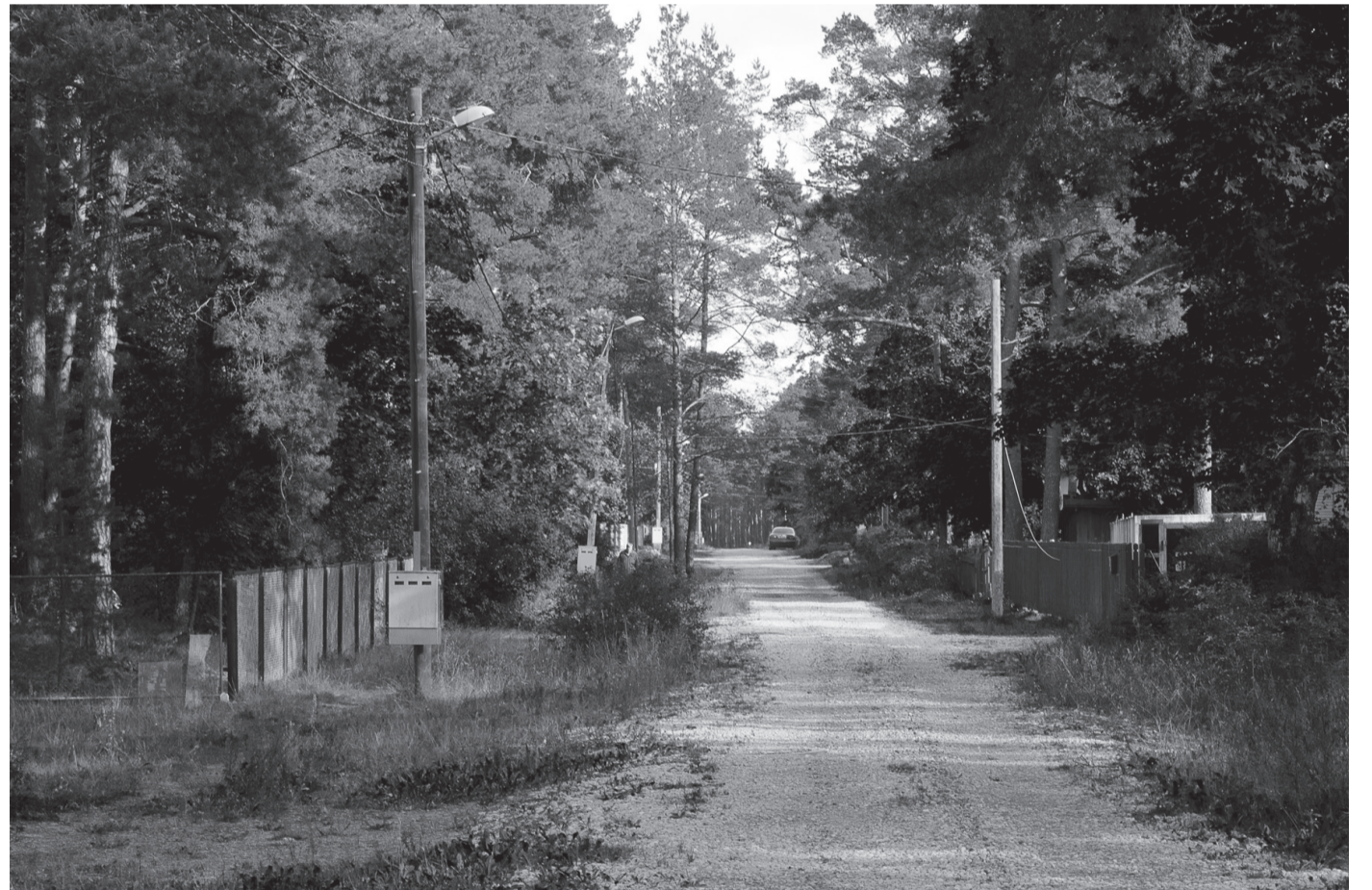
Kalevi tn. Narva-Jõesuus täna

Jekaterina Gritskova Foto loo kangelanna arhiivist.