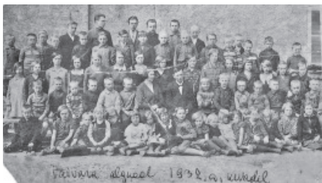
Vaivara algkooli õpilased ja õpetajad 1932. aasta kevadel.