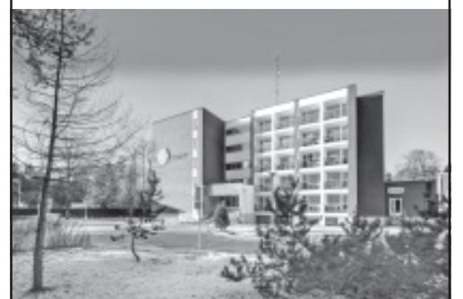
Hotell Liivarand.