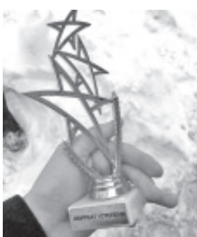
Tantsukollektiivi Kullerkupp võidukarikas

Vaatamata kõigile raskustele ja ärevusele (viimasel hetkel ei saanud kaks meie kollektiivi tütarlast kaasa sõita) sai