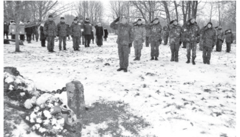
Pargade panek mälestussamba jalamile.

sinibarettide (st rahuvalvajate) aumedaliga väljapaistva panuse väljajäetava sõpruse valdkonnas. Erna selts tänas Talveristiga häid kamraade koostöö eest seltsiga ja Utria võistluse läbiviimisel.