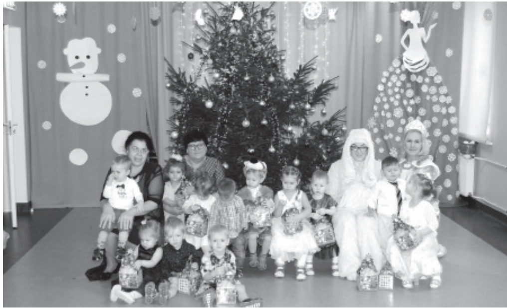
Jõulupidu Olgina lasteaias.

kaunistati ruumid, valmistati jõululaatadeks, käidi päkapikumaal ning oodati pikisilmi päkapikke ning jõuluvana. Igas rühmas olid vahvalt sokid seinal rippumas ning oi seda rõõmu, kui üles ärgates sealt midagi leiti! Rõõm laste silmades on nii siiras, et muudab kohe kõigi tuju veelgi paremaks. Lasteaed on koht, kuhu me kõik peame tulema hea tujuga ning õnneks näeme seda igapäevaselt, et