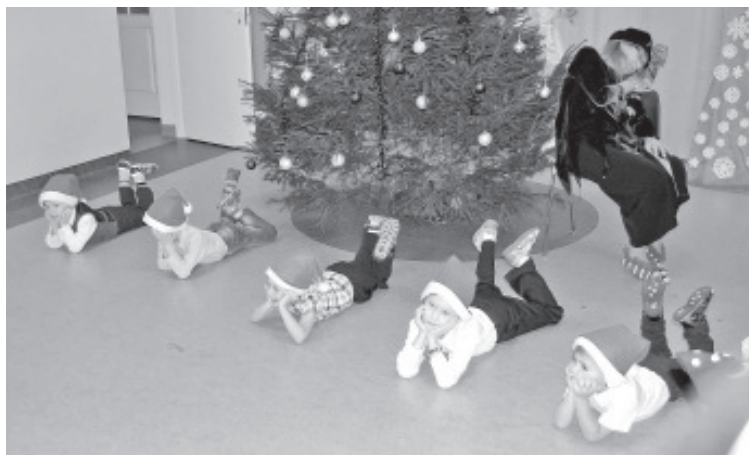
Jõulupidu Sinimäe lasteaias.

Nüüd jääb üle vaid kevadet oodata, et seda kõike täiega nautida. Õnneks on sel aastal ilmataat meie sõber ja me oleme väga palju kelgutada saanud,