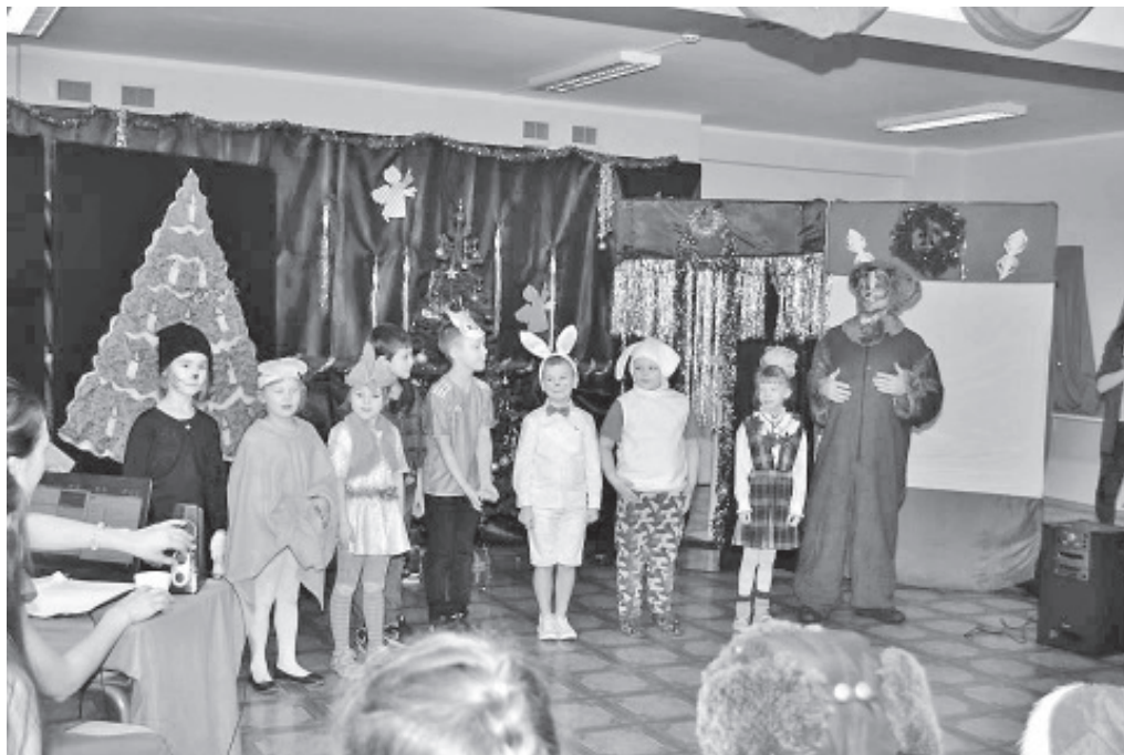
Jõulupeol Narva-Jõesuu koolis.