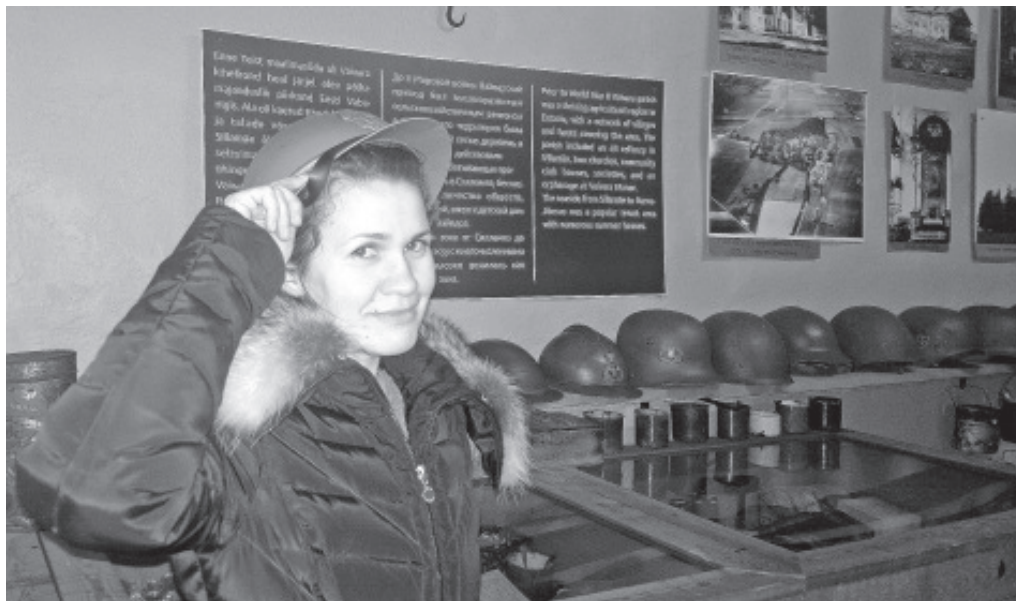
Üks näitusel väljapanud kiivritest.

Vaivara Sinimägede muuseumis on 2018. aasta jooksul võimalik näha väikest kiivrite näitust. Väljapanek on pühendatud Eesti Vabariigi 100. sünnipäevale, ning seal on kiivreid erinevatest aegadest: alates I Maailmasõja algusest kuni 20. sajandi 90ndate aastateni.