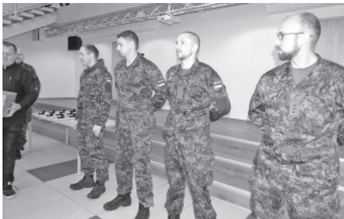
Utria dessandi võitjad autasustamisel.

Jõesuu Linnavolikogu esimees Veikko Luhalaide 99 aastat tagasi toimunud dessandi tähtsust Eesti ajaloos ja tänas kõiki, kes selle mälestusüritusega seotud on olnud.