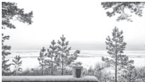
Kena vaade kohvikust Albatross

nüüdsest tasuta transfeeri teenust - kaks korda päevas Narva ja tagasi – siis külastavad puhkajad Igori sõnul kindlasti ka Narva linna. Kuna aastavahetuse puhkused on siiski väga lühikesed, siis ei usu ta, et turistid jõuaksid kusagile kaugemale sõita. Aastavahetus on edukas ka linna söögikohtadele. „Venemaa turistide osakaal