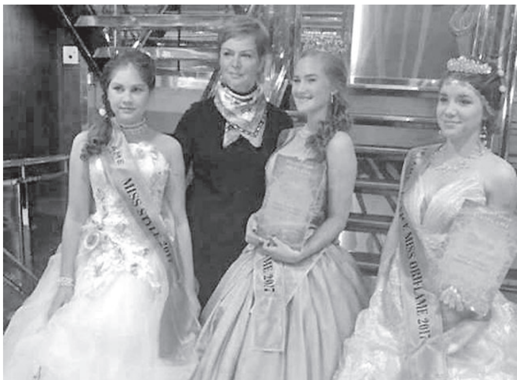
Meie tiitlivõitjad.