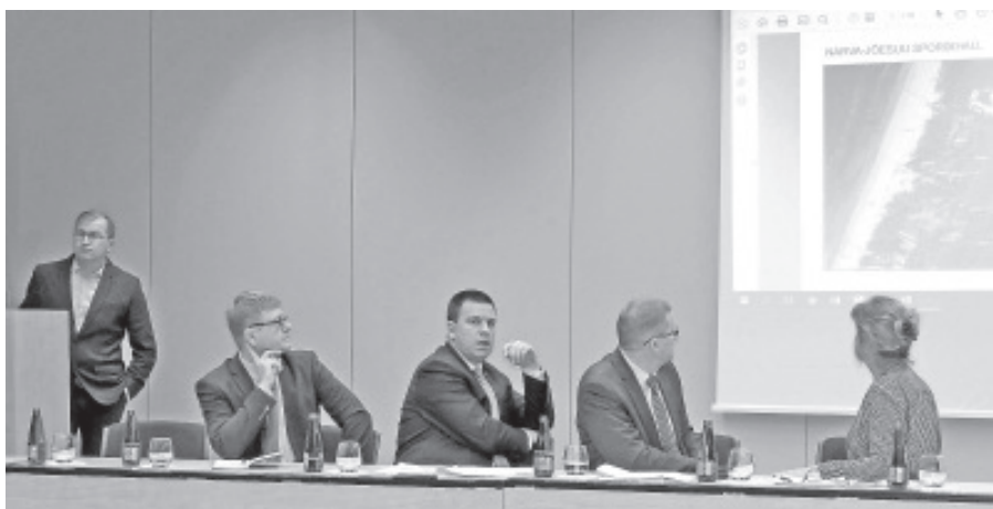
Kohtumisel peaminister Jüri Ratasega.

Peaminister väljendas muret selle üle, et Ida-Virumaa elanike arv on vähenemas. Ta loodab, et Ida-Virumaa riiklik toetusprogramm