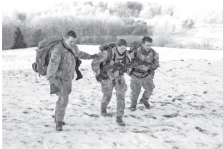
Võistlejad Utria dessandil.