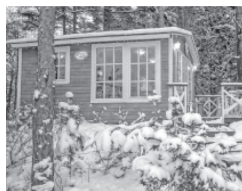
Kohvik Albatross.

moodustab aastavahetusel koguni 90 protsenti külalistest,“ rõõmustas kohviku Albatross juht Natalja Pesotšinskaja. „Oleme avatud alles kolmandat aastat, kuid iga aastaga on meie söögikoha täituvus stabiilselt 20 protsenti võrra tõusnud. Saime tuntuks tänu kodustele küpsetistele ja oleme positiivset vastukaja saanud Narvast,