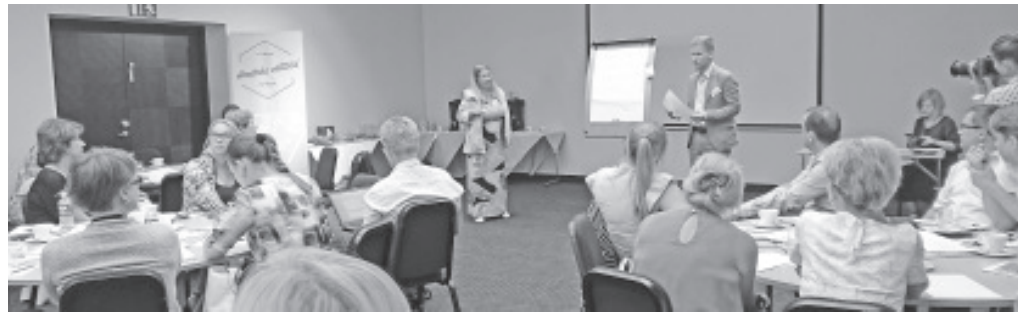
7. augustil toimus välitööde raames üks esimesi kohalikke seminare.

Kuigi välitööde üheks eesmärgiks oli erinevatel seminaridel välja valida kõige säravamad, uuenduslikumad ideed, millega veidi liialdatult öeldes alustada maailma parandamist, ei pruugi tavapärasel lahendusel sugugi kehvedamad olla. Nii ei mõeldud meie seminaril välja ühtegi uut äppi, mis probleemid võluvitsana kaotab, ei käidud välja ideed muuta Jõesuu Eesti IT-