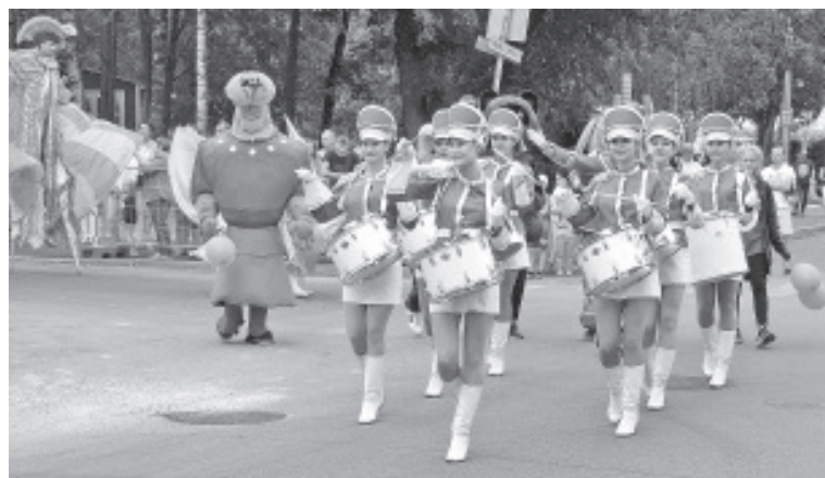
Rongkäigus püüdsid pealtvaatajate pilke kaunid trummitüdrukud.

teisi konkursil osalenud tüdrukuid, kellele omistati erineva kategooria auhinnad. Pidustuste kulminatsioon oli