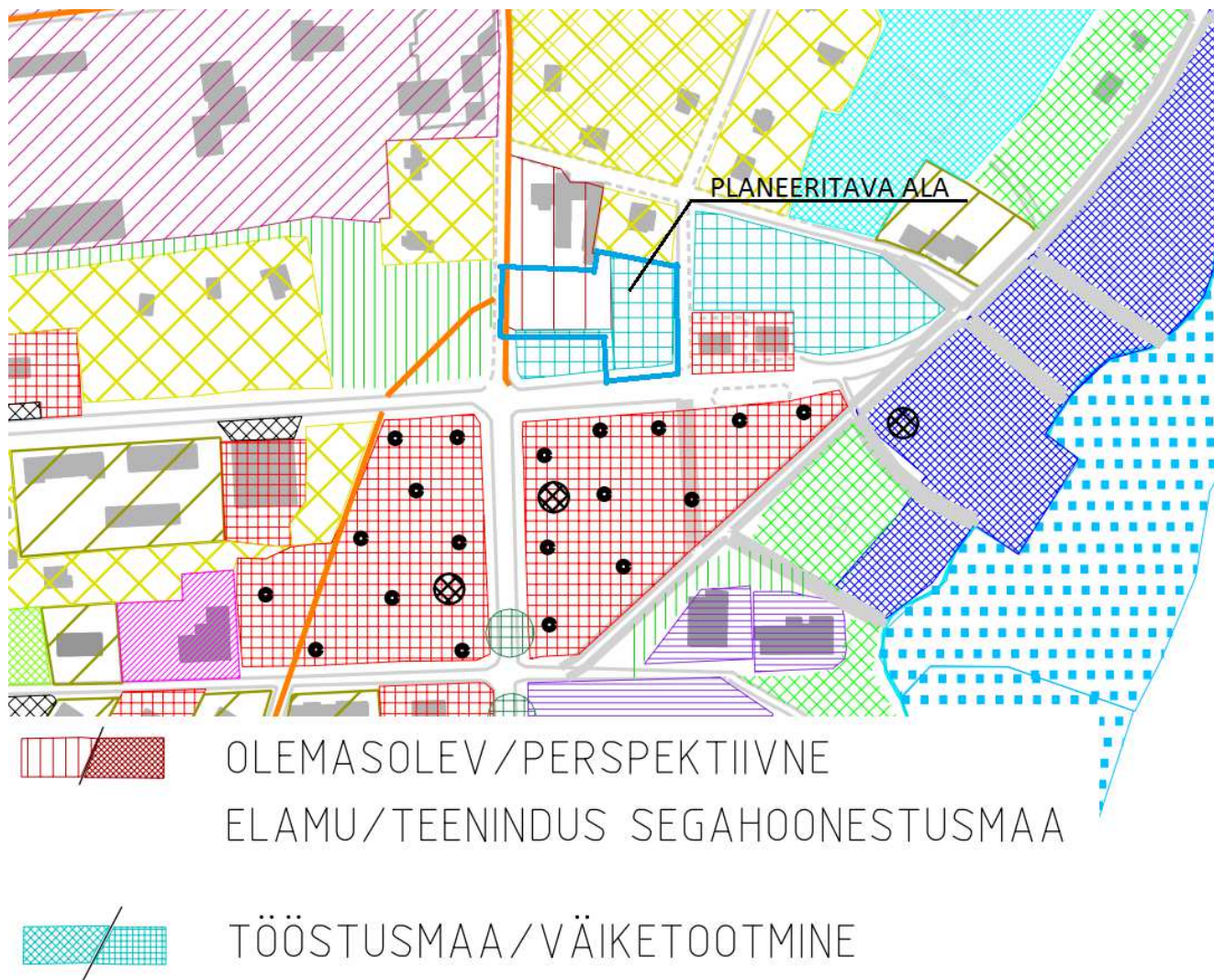
Joonis 1. Väljavõte Narva-Jõesuu linna üldplaneeringust

Töö number: 452-2016 Töö nimetus: Narva-Jõesuu linna Jaan Poska tn 16 kinnistu ja lähiala detailplaneeringu eskiis Krundi aadress: Jaan Poska tn 16, Narva-Jõesuu linn, Ida-Viirumaa Koostaja: Narva Ehitusprojekt OÜ Töö väljaandmise aeg: 08.07.2016 Stadium: DP-eskiis