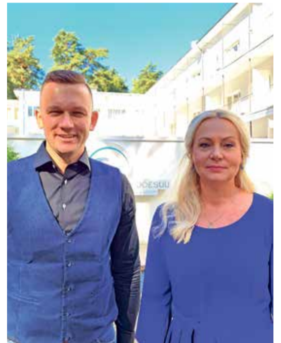
Мэр города знакомит министра Рийну Солман с городом Нарва-Йыэсуу.