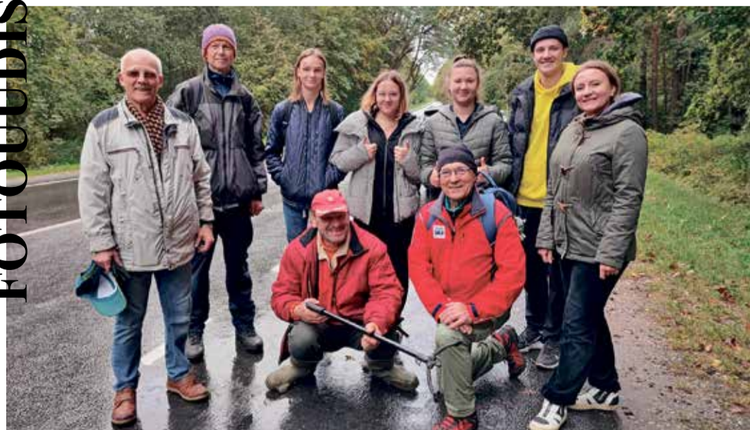
На дне всемирной уборки осенняя погода не помешала собирать в мешки мусор в лесу и на пляже.