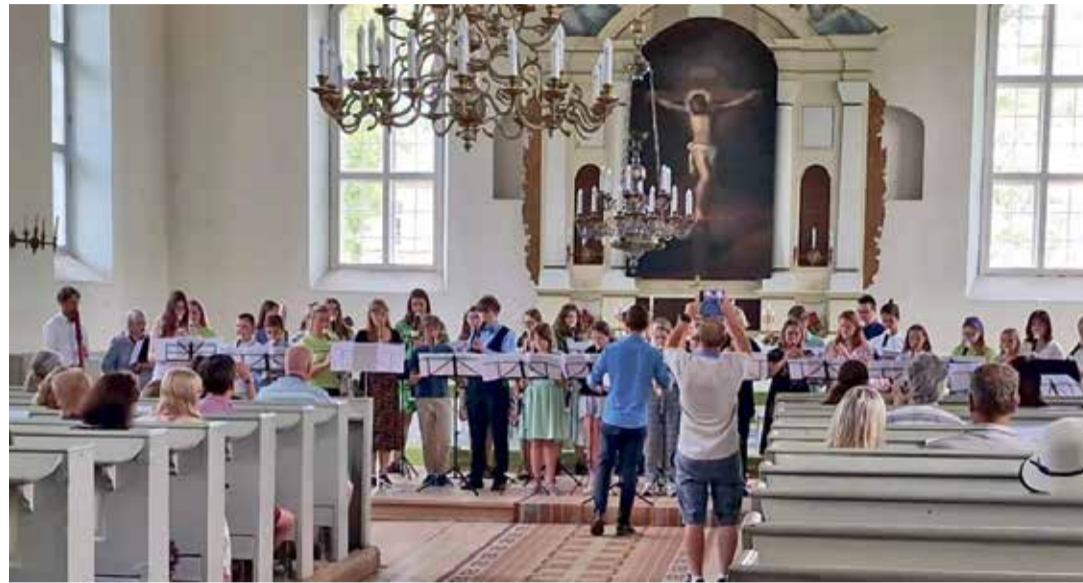
Концерт летней школы ансамбля блок-флейты в церкви Рыуге.

Кто же в Детской Музыкальной школе Нарва-Йыэсуу не расстался с нотами в дни школьных каникул? Рассказывают преподаватели.