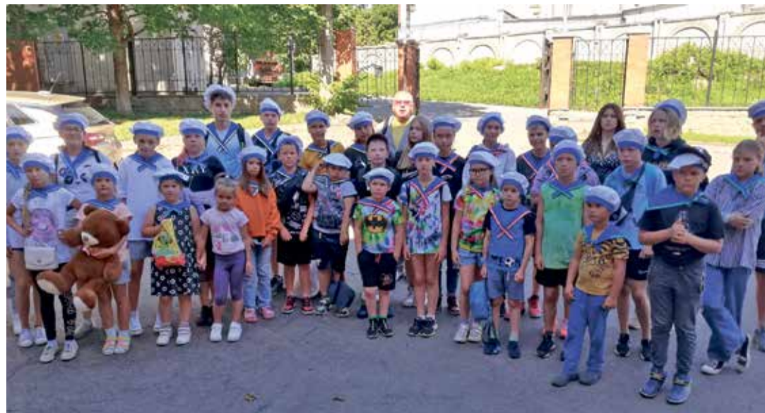
Большие и маленькие летнего лагеря Ольгина.

В первый день, как обычно, ребят распределили по отрядам, где были старшие и младшие вожатые. «Лимоны» - Андрей Маркус и Максим Мосин, «Малинки» - Карина