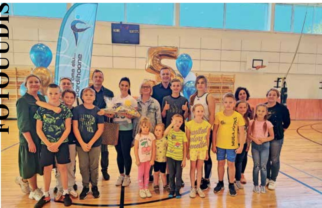
Уже пять лет спортивное здание Синимяэ является другом для всех наших, кто ценит спорт. Как для маленьких, так и для больших.