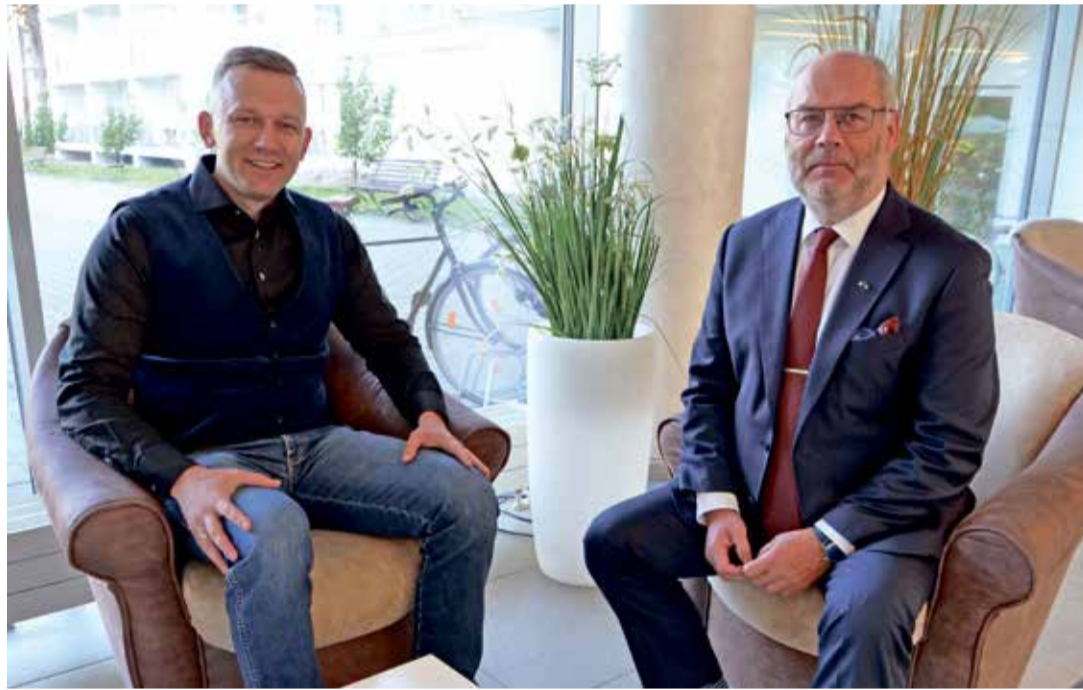
Встреча с президентом за завтраком.

«В ходе встречи также обсуждались темы распределения подоходного налога, установления дохода от туризма и изменения предельного размера земельного налога. Министр согласился с тем, что государство уже сегодня должно серьезно заняться всем этим, чтобы повысить тем самым автономно