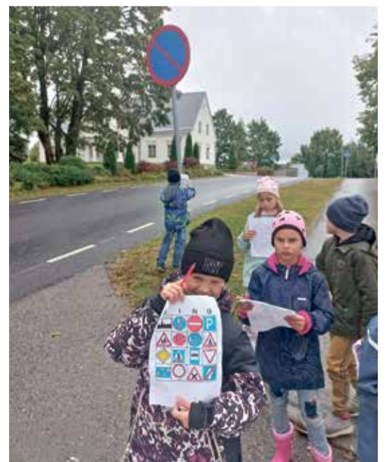
В школе Синимяэ чаще проводят занятия во дворе.