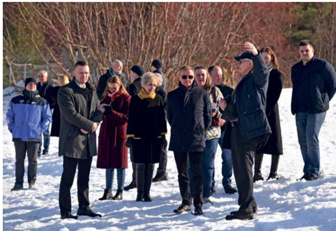
Külalised muuli asupaigaga tutvumas.

Narva-Jõesuu linna arengule annab muuli ehitamine tugeva sotsiaalmajandusliku tõuke, sest avab ukse suurtele erainvesteeringutele. Mitu Narva jõe suudmes nii tööstust kui ka kinnisvara arendada soovivat ettevõtjat seavad muuli valmimise eelduseks investeerimisotsuse langetamise. „Praegu ettevõtjad ootavad, sest Narva jõe merelt ligipääsu puudumine takistab nende äriplaanide realiseerimist,“ tõdes Narva-