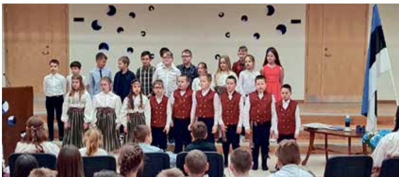
Aastapäevapeol Sinimäe koolis.

12. märtsil külastas meie kooli Hariduskopter ja 26 tulevat õpetajat, erispetsialisti, kes huvitusid töövõimalustest Ida-Virumaal. Tutvustasime ühiselt Sinimäel Narva-Jõesuu ja Sinimäe kooli. Lisaks oli direktoril ja õppejuhul võimalus osaleda ka teiste