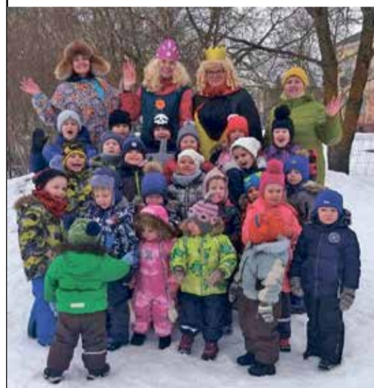
Vastlapäeval Olgina lasteaias.