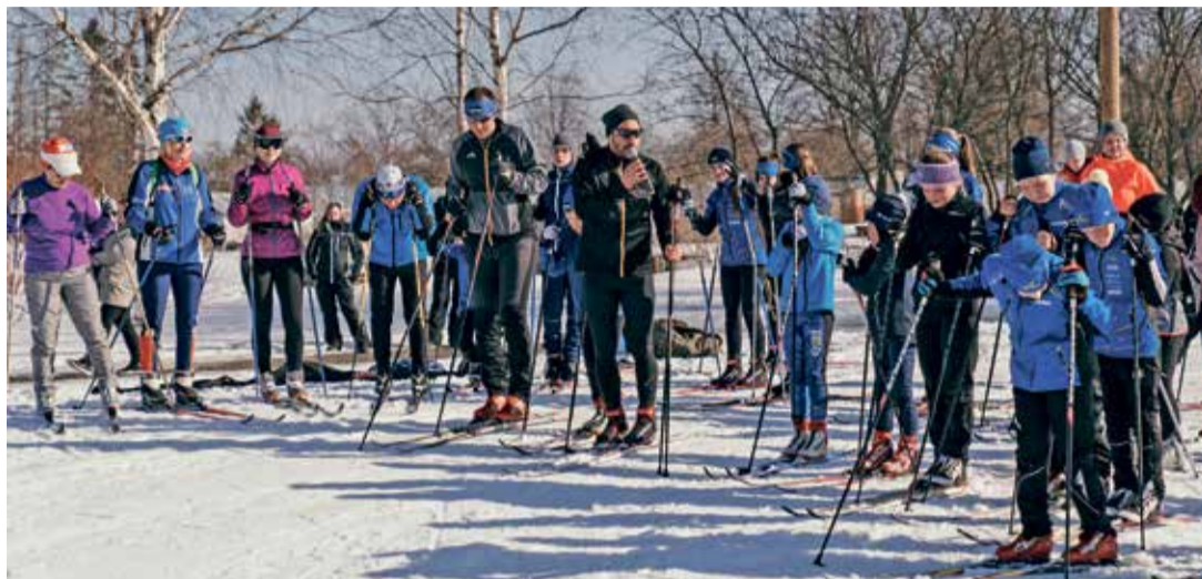
Suusamatk võib alata.

Tema mälestuseks on Narva-Jõesuu otsustanud alates sellest aastast korraldada Sinimäel igal aastal suusamatka/suusavõistluste. Üritus korraldati Vladimir Vshivtsevi ja suusaspordiklubi Äkke toetusel. Üritusel osales kokku 33 inimest. Nende hulgas