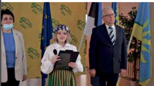
Kodumaa sünnipäev Narva-Jõesuu koolis.

Etlemliskonkursil kõlasid Eesti luuletajate luuletused, mis ülistavad oma sünnimaad. Ja konkursi võitjad ei esinenud mitte ainult kooli pidupäeval, vaid said ka õiguse tervitada linnaelanikke 24. veebruaril riigilipu heiskamise pidulikult üritusel.