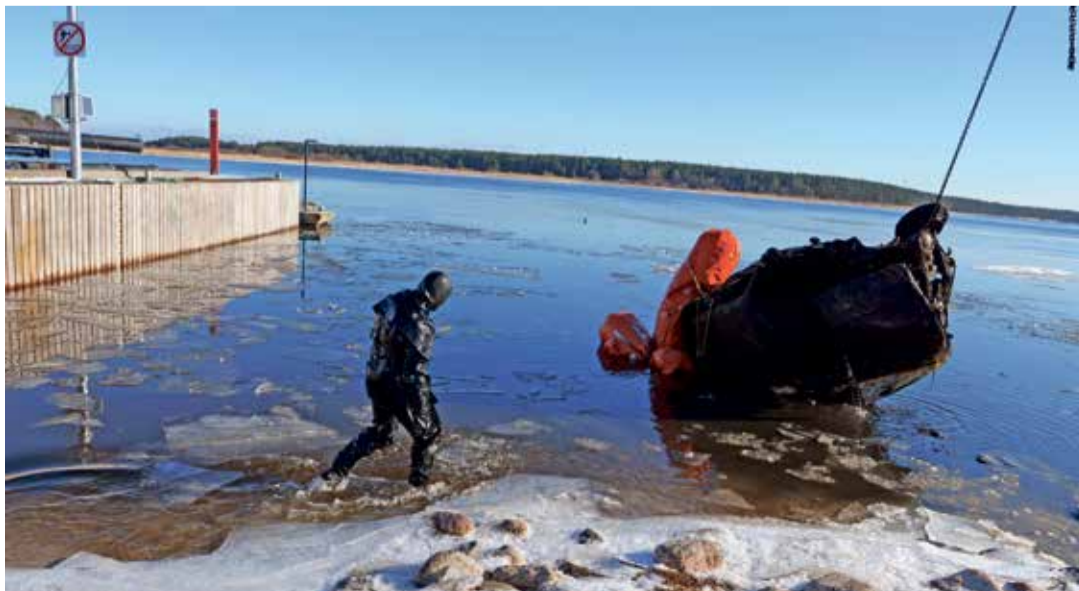
Elanikud on autovrakist edukalt põgenenud.