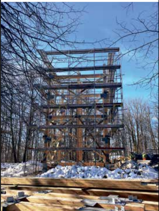
Uus vaateorn kasvab iga päevaga.

2008. aastal ehitatud vaateorn oli turistide seas populaarne, kuna ülemiselt vaateplatvormilt avanes suurepärase vaade Soome lahele. Kahjuks oli puitkonstruktsioon 10 aastaga praktiliselt ära mädanenud ja muutunud külastusohhtlikuks. Seetõttu otsustati see