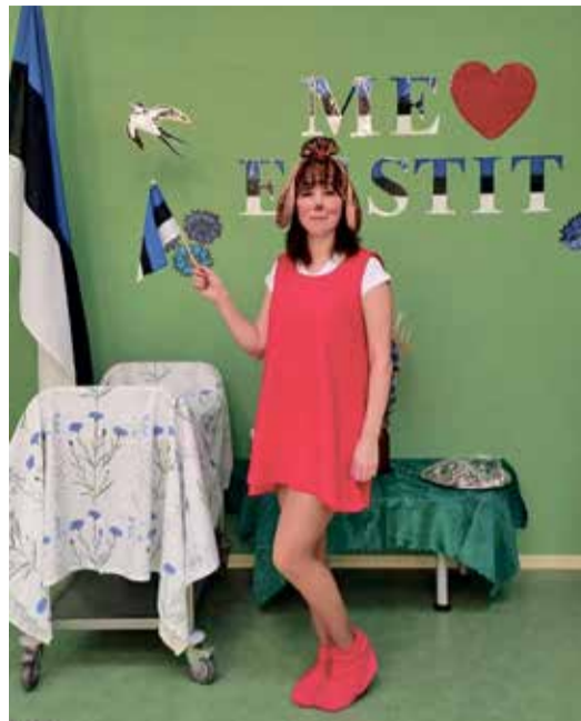
Eesti sünnipäeval oli külas laste lemmik koeratüdruk Lotte.

Kõige tähtsam üritus oli muidugi Eesti sünnipäeva tähistamine, mis toimus Vaivara