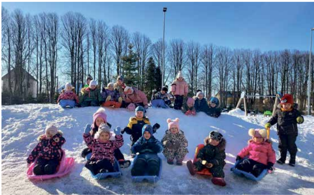
Vastlapäeval lasti ka Sinimäel liugu.

lasteaias 23. veebruaril. Sünnipäevale kutsutakse muidugi külalisi ja seekord käis meil külas koeratüdruk Lotte, kellega lapsed mängisid, tantsisid, lugesid luuletusi, mis olid pühendatud kallile kodumaale. Ei puudunud ka meie sünnipäeval tort. Elagu Eesti!