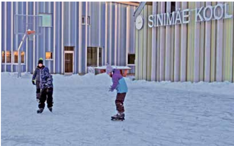
Ka uisutada on ütle mata mõnus.