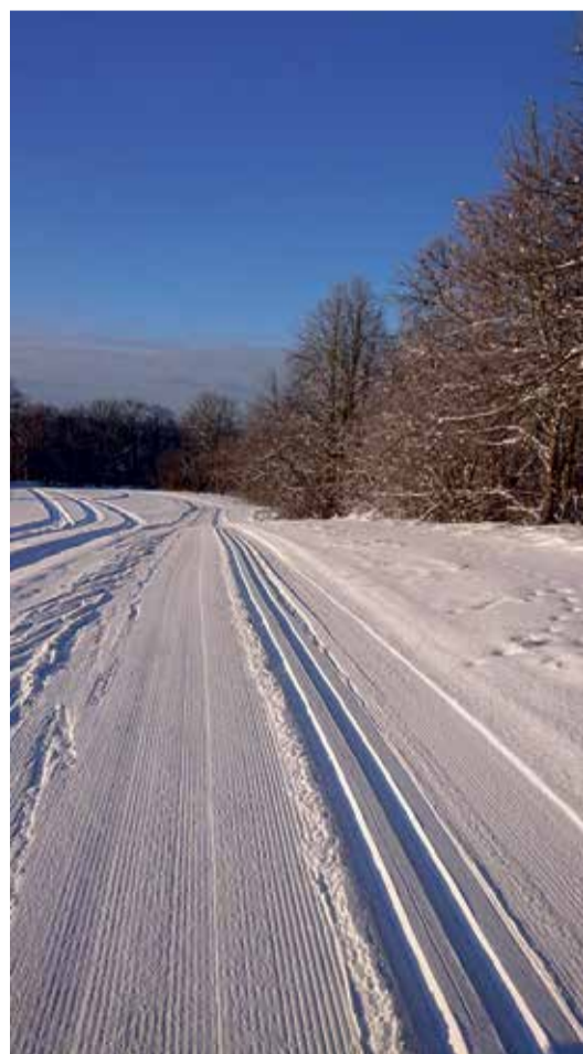
Suusarajad ootavad suusatajaid.