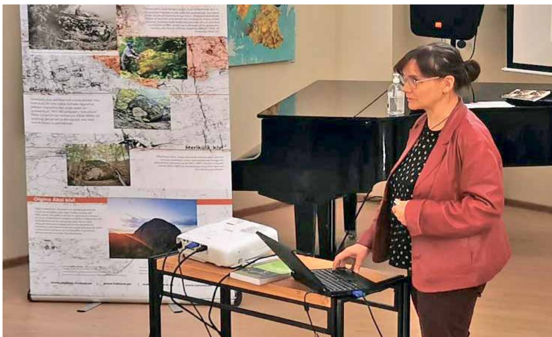
В день наследия Вайвара посмотрели выставку камней Вайвара и послушали доклады.