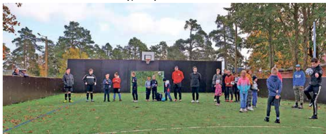
На новой спортивной площадке в Ольгина сразу начался футбольный матч.