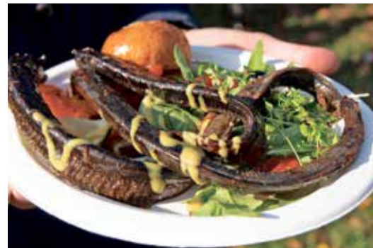
Вкусный обед из миноги.

Фестиваль окончен, а участники все ещё продолжают делиться воспоминаниями и эмоциями. И чтобы воспоминаний было ещё