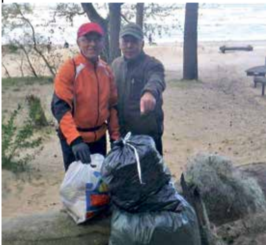
В этот раз успели закончить уборочные работы.

Уборку мы начали с улицы Лийва, а закончили в начале улицы Кирику. Альберт занялся уборкой променада и его окрестностей, нам троим пришлось поделить территорию до воды. Сильный ветер выдул из песка пакеты разных размеров, пластиковые бутылки и стаканчики, рыболовные сети и обрывки веревок. Нас удивило, как на пляж могли попасть разные кусочки ткани и ковров. Куски ковров мы