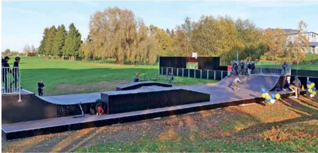
Спортивная площадка Синимяэ - это многофункциональные мини-спортивные площадки и скейтпарк.