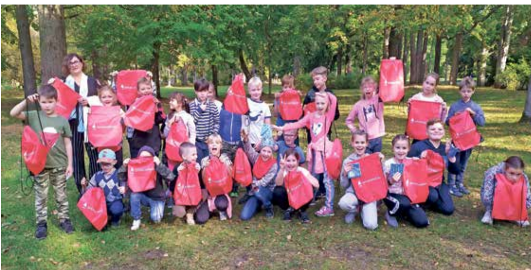
Все побывали на мероприятиях спортивной недели.