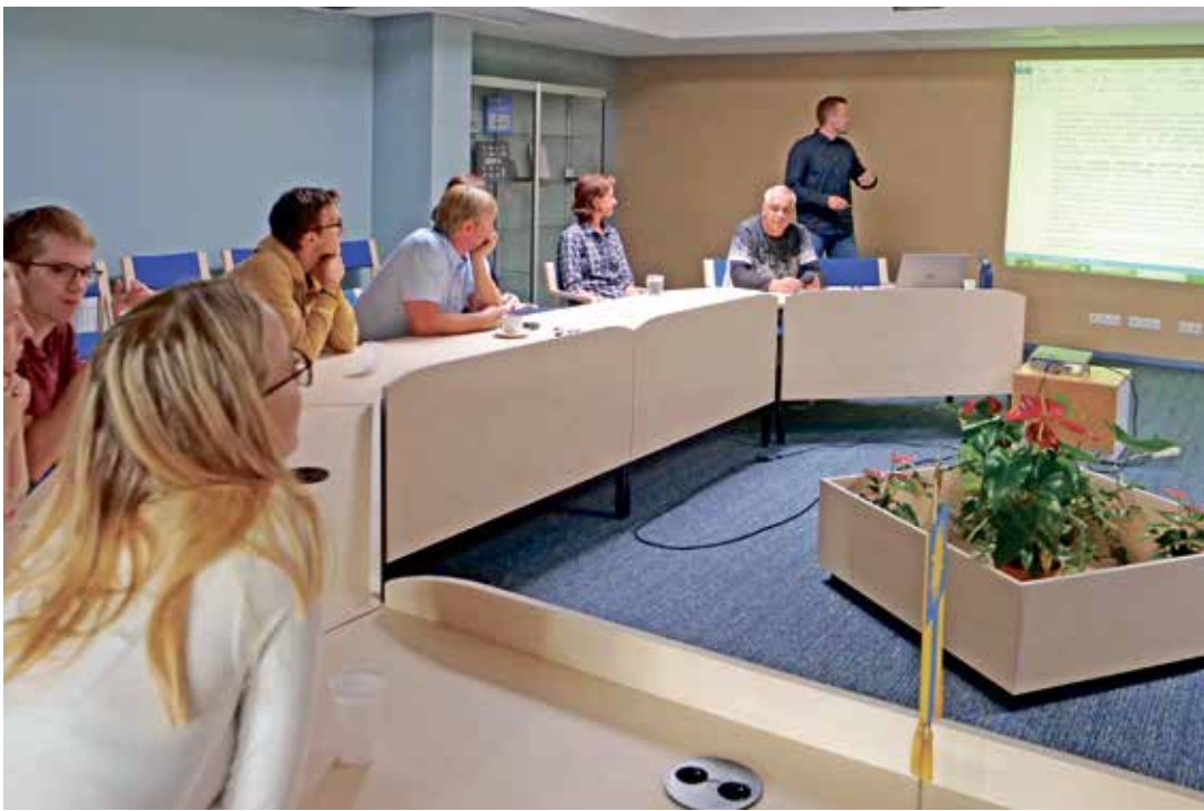
Seminarist osavõtjad Narva-Jõesuu linnavalitsuses.