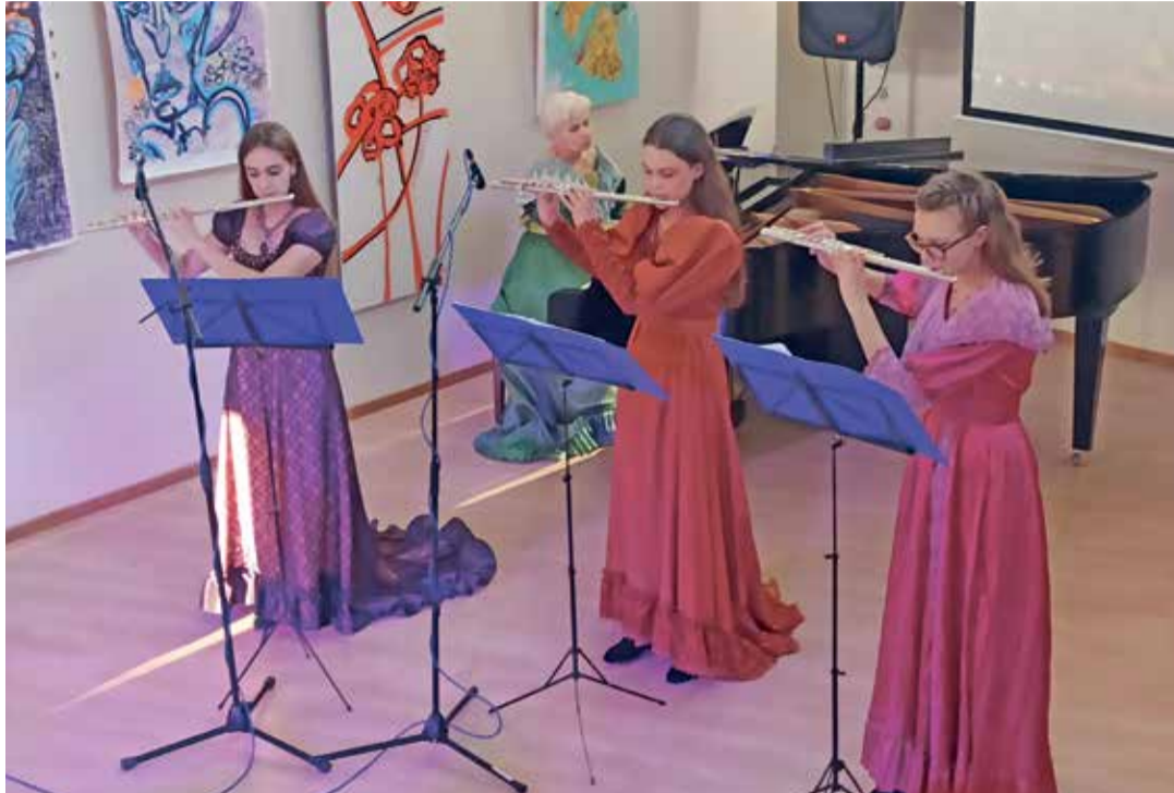
Imekaunid flöödimeloodiad aitasid luua poeetilise õhkkonna.

Muusikaline kujundus haaras kohalviibijad kaasa ühtsesse loomingulisse õhkkonda.