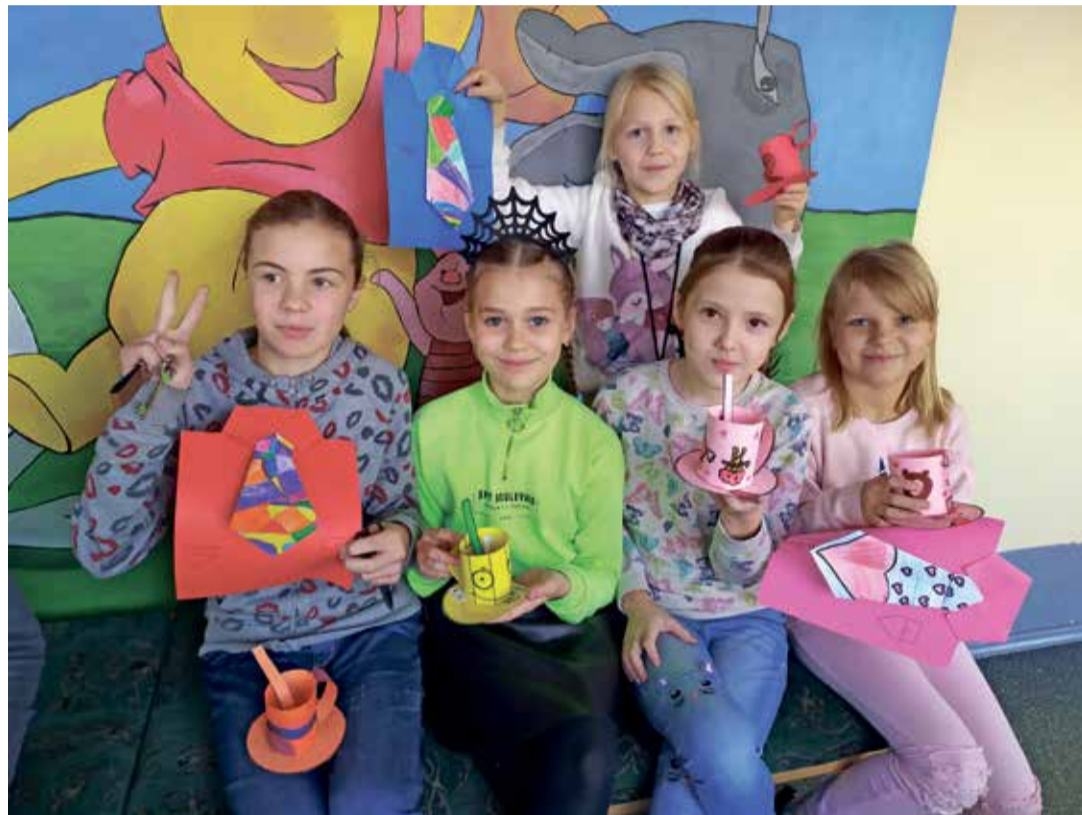
Kingitused isadele on valmis saanud.