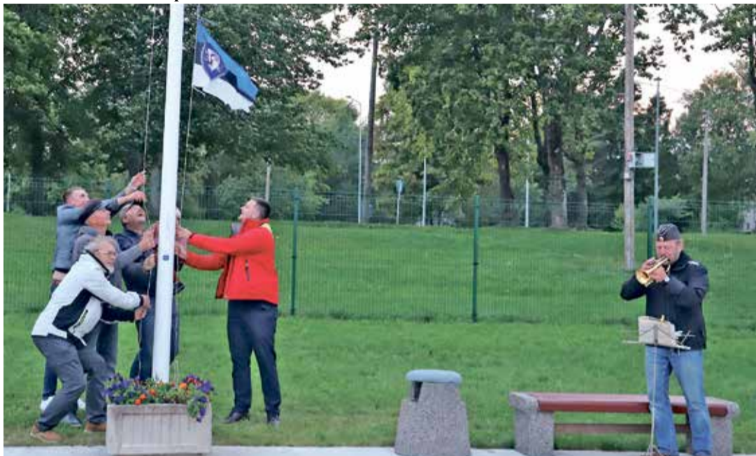
Uus lipp tõmmatakse masti trompetihelide saatel.

Sellised vimplid ehivad nüüd jahtklubi liikmete laevu.