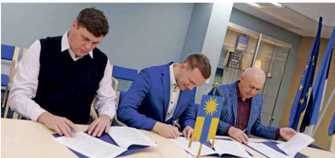
Lepingu allkirjastamine Jõhvi KEK OÜ ja Eesti ESM OÜ esindajatega.