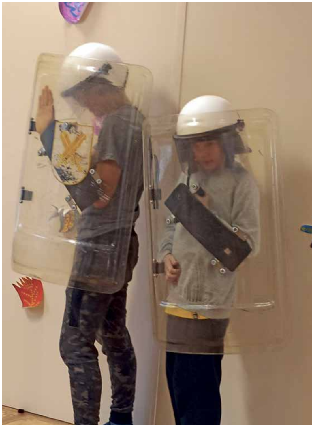
Politseimuseumi töötajad pakkusid õpilastele huvitavaid tegevusi.