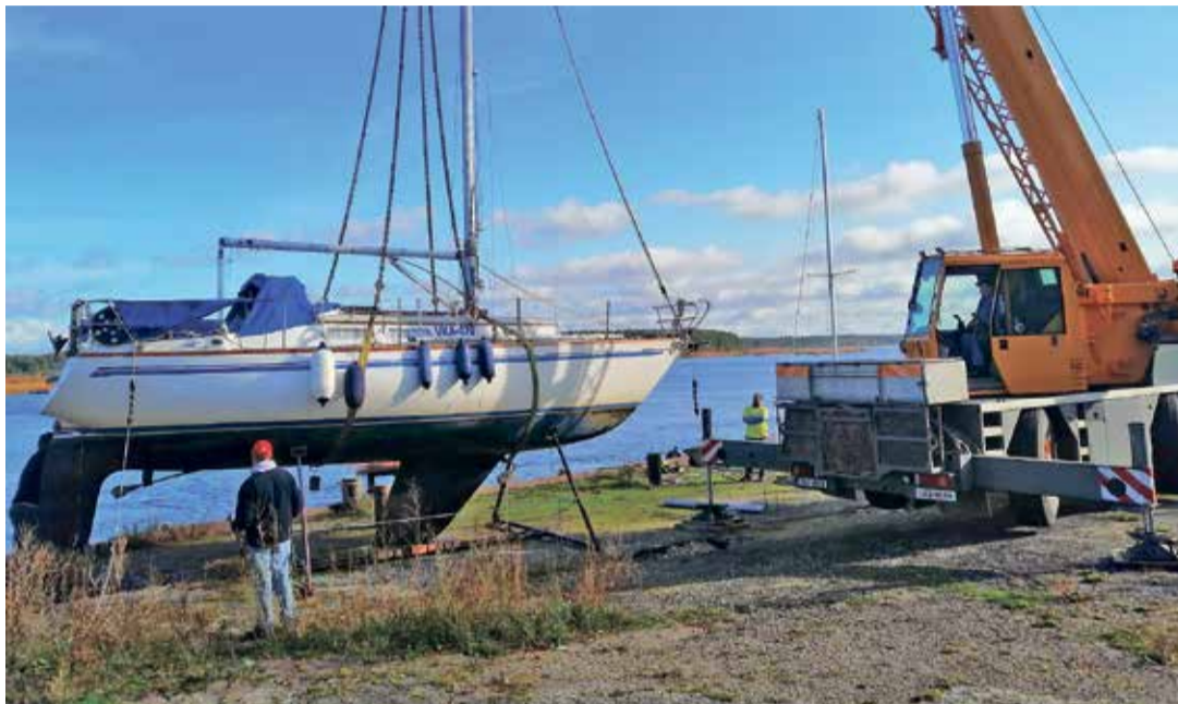
Paatide tõstmine talveparklasse.