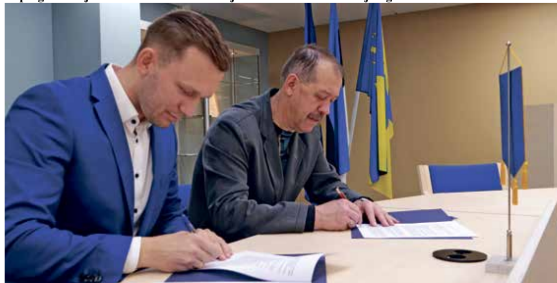
Lepingu allkirjastamine AS Vant esindajaga.