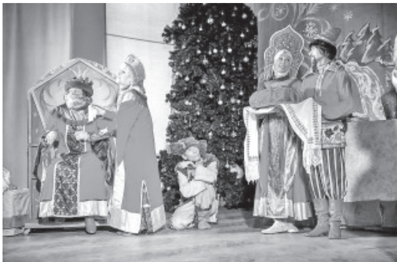
Teater Tuuleveski esitas näidendi „Havi käsul”.

Kohe etenduse algusest peale viisid muinasjutukangelased lapsed uusaastaeelse fantaasia võlumaailma. Muinasjutukangelasteks olid: Jutuvestja, Talvehaldjas, Tuhkatriinu koos printsiga, Kuningas, Rüütlilõpilane, Võlur, Võõrasema koos tütardega, Kingamoor koos Atamaniga, Näärivana ja Lumehelbeke. Muinasjututegelased mängisid koos lastega mängu, juhtisid ringtantsu ja laulsid laule,