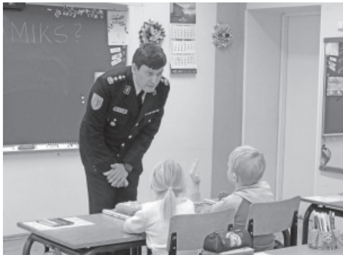
Elav dialoog õppetunnis.

Aktiivselt loengus osalemine suurendab õpilases õguskuulekust, oskust märgata abivajajat ja temale abi osutamist.