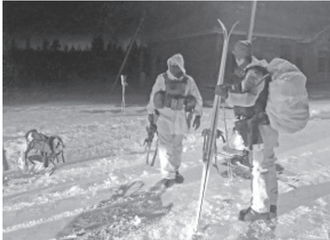
Madalmaade võistlejad Utria dessandil.

Kui kellelgi hirne oligi, siis hajusid need kiiresti ja me võime täna olla uhked