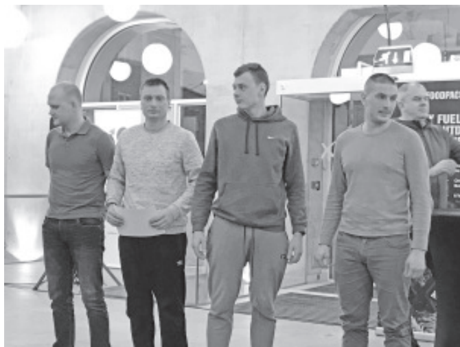
Utria dessandi võitis Kaitseliidu Pärnumaa maleva II võistkond.

suurepäraselt laabunud koostöö ja ülimalt õnnestunud võistluse üle. Ilmaolud 1919. ja 2019. aastal olid sarnased, meri jäävaba ja lumi maas. Korralik lumevaip oligi tänavuse võistluse trumpäss. Üle mitme aasta võisime kindlad olla, et trass läbitakse suuskadel.