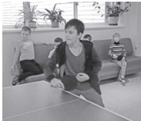
Lauatennis pakub mängumõnu paljudele.

2017/2018. õppeaastal toimus koolis turniir, millest võtsid osa nii nooremate kui