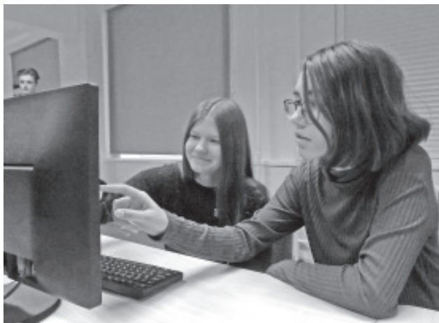
Videotund pakkus ka põnevust.

Õppetöö käigus said õpilased palju huvitavat ja tähtsat teavet. Selline õppetunni formaat oli meie jaoks uus, ebatavaline ja väga huvitav. Samas tundus meile, et paremini ja mugavamalt tunnevad õpilased end siiski klassis, kui õppejõud on nende juures ja saab vajaduse korral talle kohe küsimusi esitada.