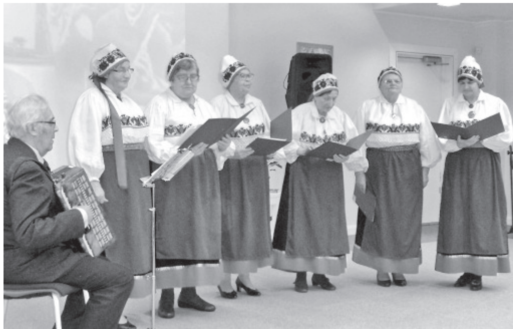
Laulab eesti vokaalansambel.

luulekogu „Vainulilled“. Teine luulekogu „Emajõe ööbik“ oli väga edukas; nii hakati kutsuma ka poetessi ennast. Oma luuleridades ülistas Lydia kodukanti, selle ilu, armastust Eestimaa, kodukoha, isamaja ja lihtsate inimeste vastu. Koos isaga organiseeris Lydia Tartu 1869. aasta laulupeo ja kirjutas mitu näitemängu, mis olid eesti rahvusliku teatri algus.