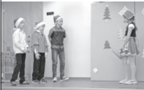
Punamütsike võib ju metsas ka päkapikkudega kohtuda.