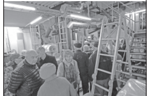
Uues katlamajas oli mida vaadata.

Toasoojuste hinnast rääkides võib kinnitada, et Adveni jaoks on oluline