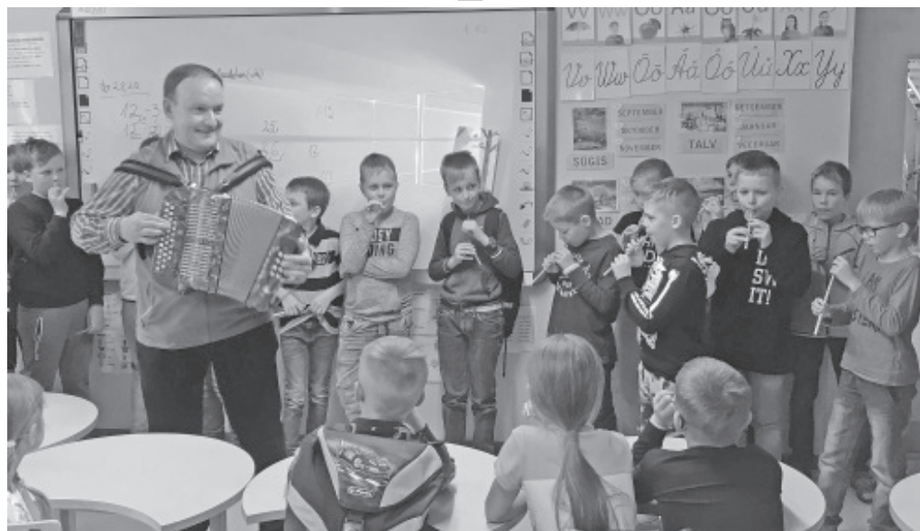
Noored muusikud mängisid Ervini lõõtspilli saatel oma kooli õpilastele polkat ja valssi.