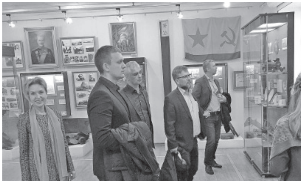
Uudistamas linnamuuseumi eksponaate.