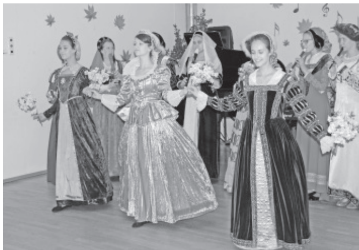
Esinemisyärg on vanamuusikaansambli käes.

LADA ŠVAN Muusika- ja kunstikooli direktor