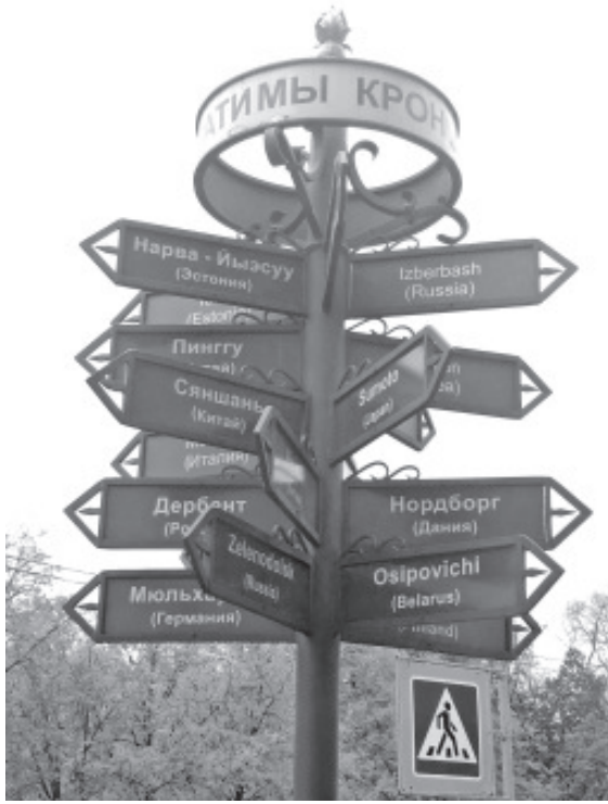
Kroonlinnal on palju sõpru.

Väikesadamate ja jahtide kasutamise kultuur on mõlemas linnas algfaasis ja tulevikus võime neid koos arendada, korraldades erinevaid võistlusi. Kultuuri ja hariduse alal leppisime esialgselt kokku, et lähitulevikus toimub linnade vahel õpilaste