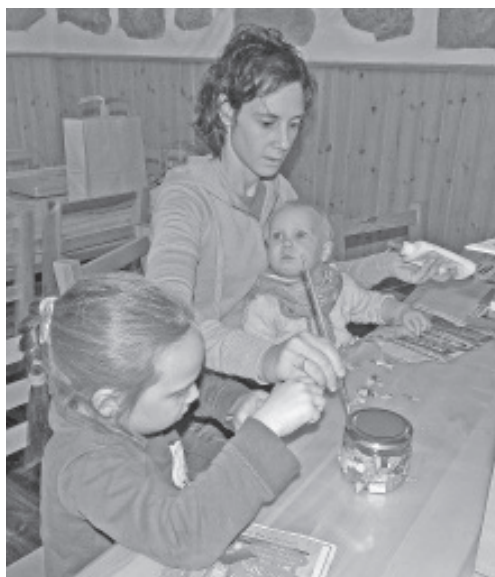
Ka Vanatare sees käib vilgas tegevus.

Me ei ole veel nii arenenud, et ilusat ilma tellida saaks ja tänu taevale, ka inimesi ei suuda me selliseid otsuseid tegema mõjutada, nagu me sooviksime. Viimane oleks algelt küll imetore omandus, aga pikas perspektiivis viiks sirgjooneliselt diktatuuri ja totalitaarsusse. Selle nimel, et elada vabas maailmas, võib suuremaidki ebamugavusi taluda, kui inimeste isepäisus ja kalduvus meile ebasoovitavate otsuste langetamiseks.