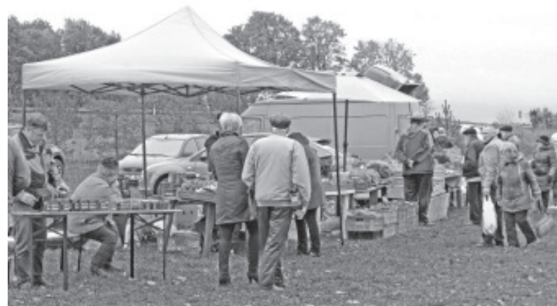
Kõigepealt tuleb kaup üle vaadata.

Enne selle kohaliku tähtsusega veeuputuse kohaleilmumist läks kõik tegelikult kenasti. Kuigi mõni plaanitud müüja jäi tulemata, tuli see-eest uusi ja huvitavaid tegijaid. Näiteks paar vanavaraga kaubitsejat. Sellised kolamäed meelitavad