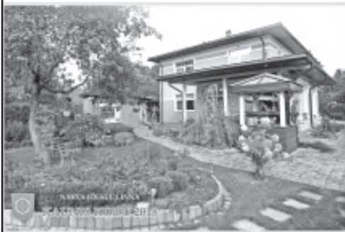
Kaunis kodu 2018.

Konkursi Narva-Jõesuu linna 2018. aasta KAUNI KODU võitis perekond BAKUNIN.