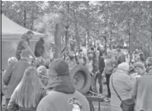
Suppi jagus kõikidele soovijatele.

Suurel linnalaadal sai osta palju erinevaid kalu ja ka silmu ning sai proovida kohalike kauplejate silmust valmistatud huvitavaid roogasid. Lastele korraldati värvilise sambila ja kommid valmistamise töötubasid. Samuti toimus huvitav sportlik orienteerumine laste ja täiskasvanute jaoks.