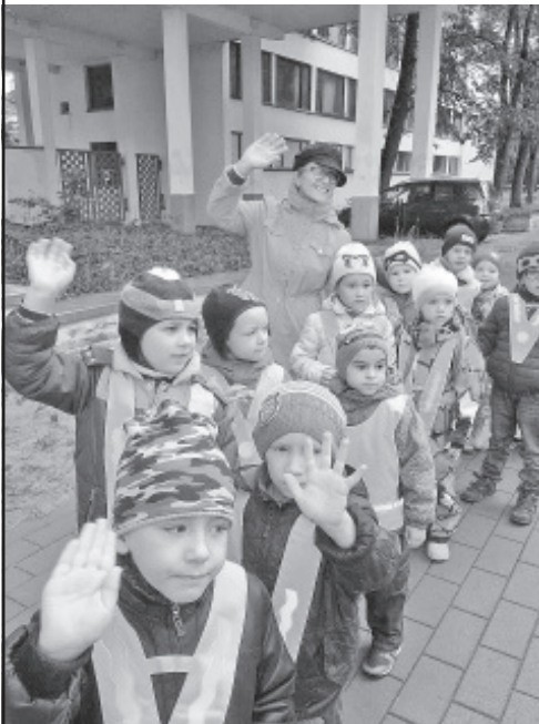
Lasteaias on huvitav ka sügisel.

Septembri algul tähistati lasteaias Karikakar teadmiste päeva. Vanema rühma lapsed käisid õnnitlemas oma 1. klassi läinud kaaslasti ja soovisid neile edu alanud kooliteel. Lasteaias on traditsioon korraldada sügisnäitusi, millesse on kaasatud kõik lapsevanemad. Kodudes lapsega koos välja mõeldud ja ühiselt valmistatud eksponaat väljendab pere loomingulisust fantaasiat. Sügisande leiab ju nii aiast kui metsast ja