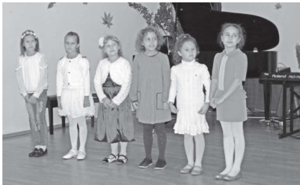
Tavakohaselt pühitseti esimese klassi õpilased kontserdi ajal Nooreks Muusikuks.