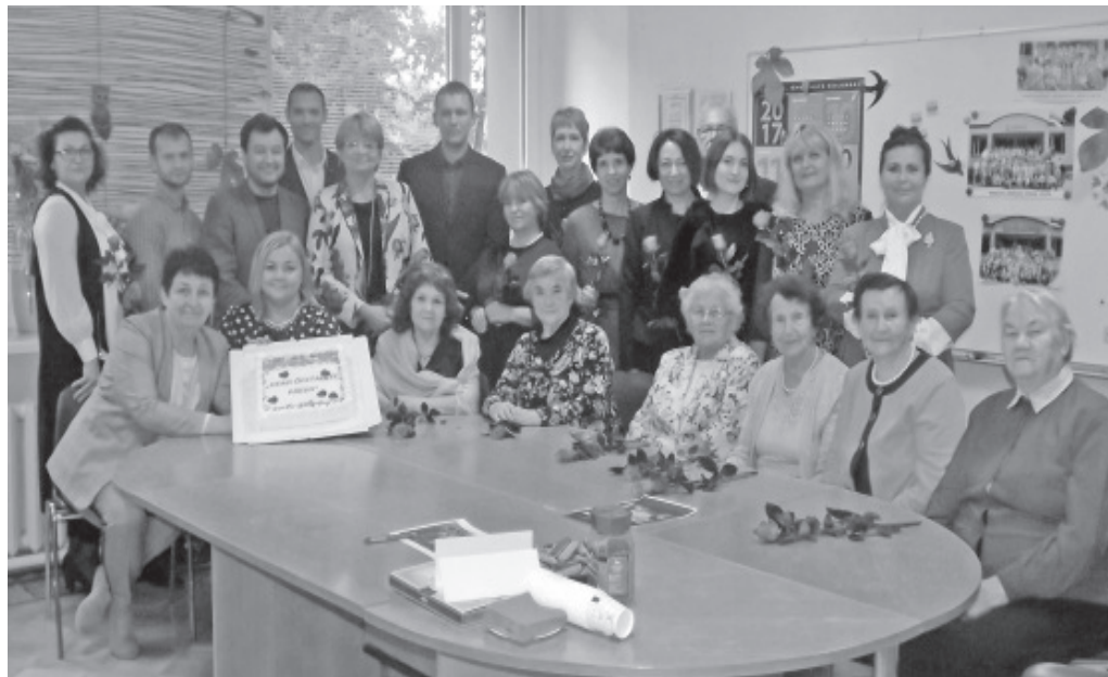
Kaunist õpetajapäeva!

Me lisame oma ellu igal sügisel uusi sihte. Tänavu toetame haridusministeeriumi algatust digitaalsete õpikute kasutusele võtmiseks. See vähendab koolikoti kaalu ja võimaldab muuta õppeprotsessi huvitavamaks – on ju paberkanja võimalused piiratud, digitaalsete ülesannete