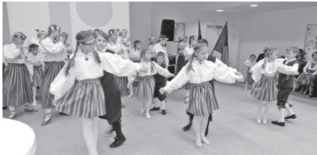
Esineb tantsurühm Kullerkupp.