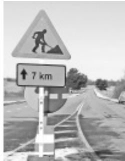
Ettevalmistused teeremondiks on tehtud.

Kokku on ehitusele mineva teelõigu pikkus veidi üle 7 kilomeetri. Projekti kogumaksumus on 3 miljonit eurot, tee ehitaja on OÜ Viaston Infra.