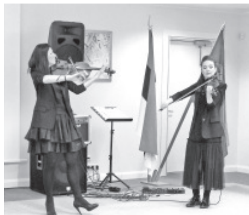
Kaunid viulilood kõlavad D'Art Duo esituses.

Tiiu Toom – aktiivse osalemise eest linna kultuurielus