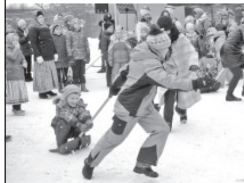
Võinädala tähistamine Narva-Jõesuus.

18. märtsil toimus kohviku Lemmik alal tõeline rahvakogunemine – võinädalat tähistati laulude, mängude ja tantsudega. Viimased talvepäevad rõõmustasid tõeliselt