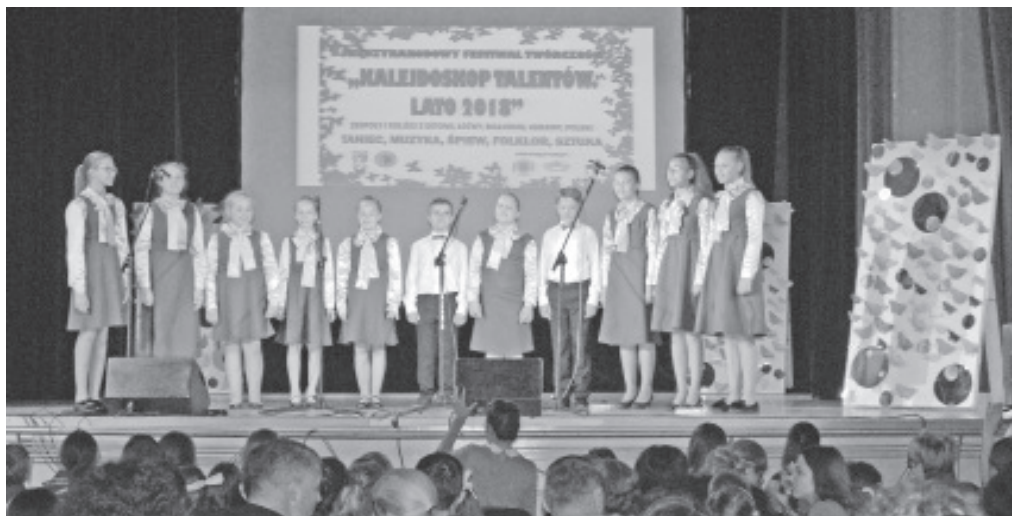
Выступает вокальный ансамбль.

Отправляясь в путь, ребята и учителя музыкальной школы даже не предполагали насколько успешным будет их выступление на гостеприимной живецкой сцене.