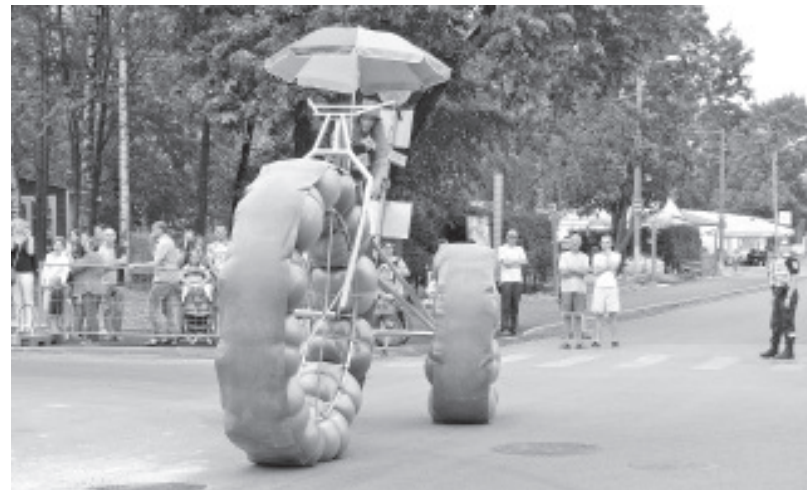
В начале шествия был большой надувной велосипед.