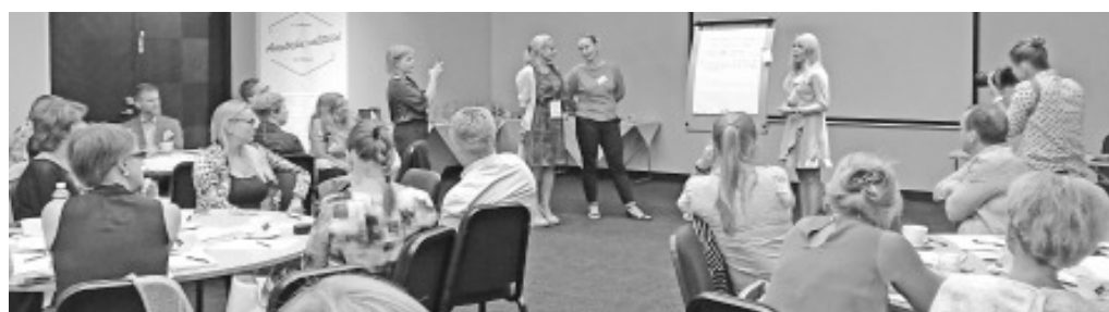
7 августа в рамках полевых работ один из первых местных семинаров.

В этом году инициатива приняла более масштабный размах – если весной Пирет и Эдуард надеялись, что вдруг их призыв услышат 40, а то и 80 столичных чиновников, то они недооценили заинтересованность Ида-Вирумаа, заботы и радости этого региона. Я тоже был одним из тех, кто сразу же сообщил о своей готовности участвовать. Возможно, основной причиной стало то, что мои не столь далекие корни уходят как раз сюда, в Нарва-Йыэсуу.