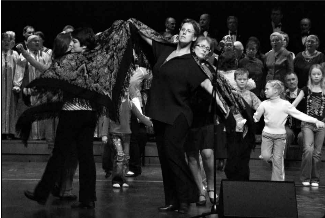
"Kullerkupp" proovil enne galakontserti Jõhvis.